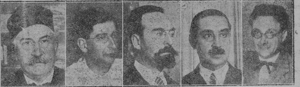
De izquierda a derecha: Don Alejandro Lerroux, de Estado; don Marcelino Domingo, de Instrucción; don Fernando de los Ríos, de Justicia; don Miguel Maura, de Gobernación; don Luis Nicolau d'Oliver, de Economía.