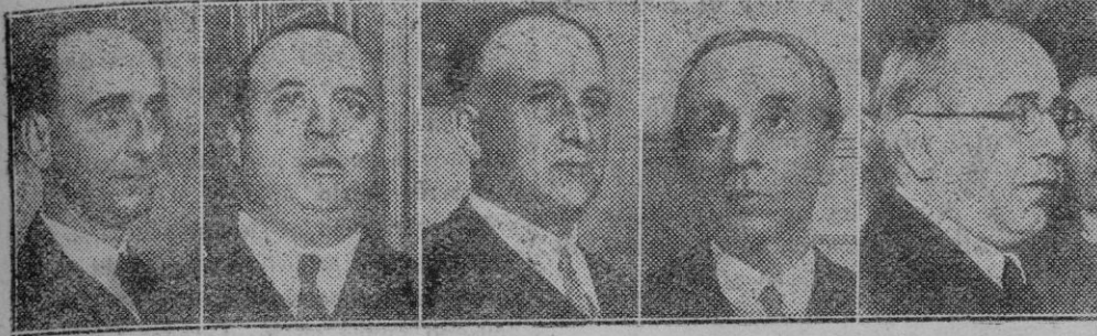
De izquierda a derecha: Don Santiago Casares, ministro de Marina; don Indalecio Prieto, de Hacienda; don Francisco Largo Caballero, de Trabajo; don Alvaro de Albornoz, de Fomento; don Manuel Azafia, de la Guerra.