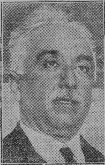
Don Niceto Alcalá Zamora, Presidente del Gobierno provisional.