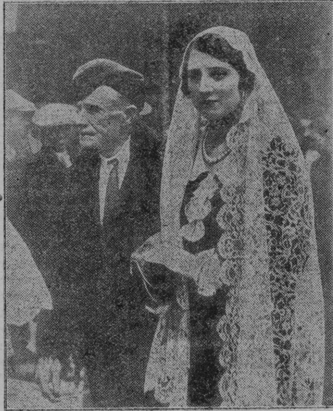
Homenaje a la vejez. — Santa Coloma de Farnés (Gerona). La madrina de un viejecito acompañándole al lugar del homenaje.