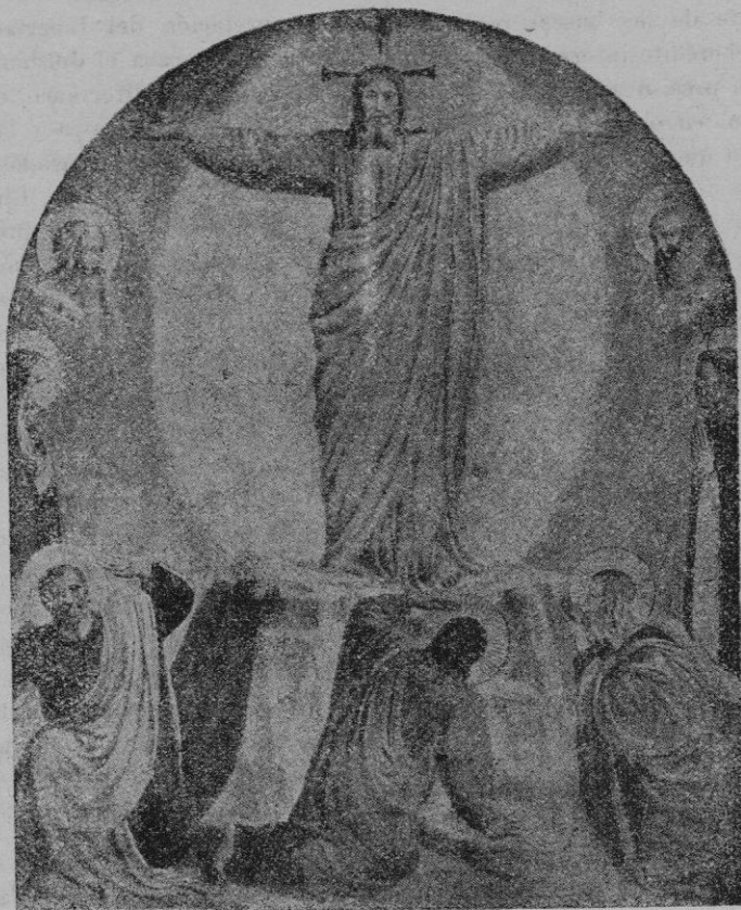
La Resurrección, por Fray Angélico.

latín y... con mala letra, más difíciles de hallar y leer que libros franceses o alemanes, basados muchos en incompletas referencias, o en notas tomadas en rápidos viajes por la tierra incógnita, de la cantera por explotar de la investigación metódica, seria y honrada.