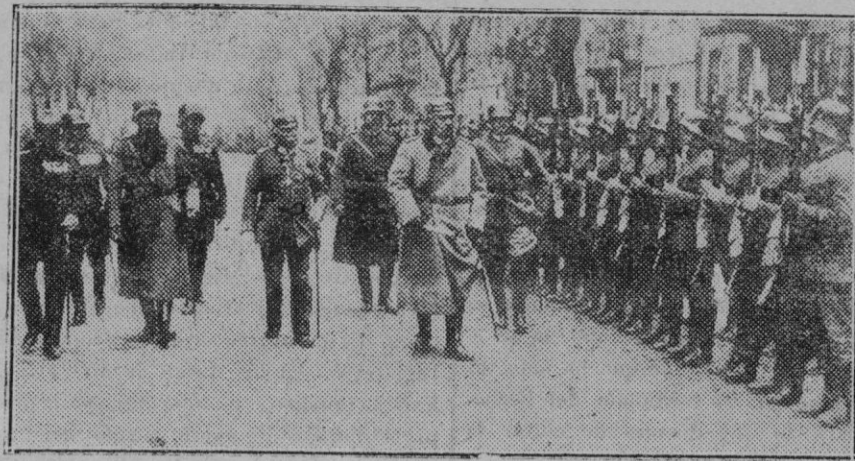
Berlín. — El Presidente Hindenburg pasando revista al nuevo regimiento de infantería de Potsdam.

guntarle "¿Quién eres?", para que El responda: "Yo soy el que ha venido a dar testimonio de la Verdad". Muchos filósofos de hoy siguen preguntándose como Pilatos—en quien se personificaba el racionalismo del siglo de Augusto— "¿Y qué es la Verdad...?". Volviendo a las palabras con que Unamuno termina el citado libro: "Notre Christ, notre Christ, pourquoi nous as-tu abandonnés?"; que manifiesta todo el dolor de los que, como Keyserling, Unamuno y Alomar, ya no creen, y sienten el ansia viril de creer en algo.