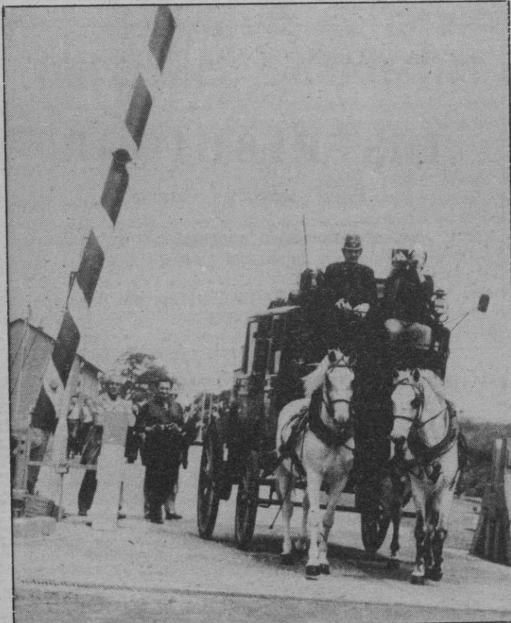
Hungria.—Un coche-correo a la antigua usanza, atraviesa la frontera húngara, cargado con un precioso paquete conteniendo los sellos que serán mostrados en la Exhibición Mundial del Sello de Viena, que ha sido inaugurada el pasado domingo. Los paquetes son transportados a la estación fronteriza por un mensajero vestido con el uniforme de cartero de los viejos tiempos.

Como se ha venido informando, el Gobierno deberá enviar durante el mes de junio a todos los ministerios y organismos autónomos las instrucciones definitivas para la elaboración de los presupuestos generales del Estado, que realizarán las oficinas presupuestarias de cada uno de estos organismos y devolverán al Gobierno durante el verano, de forma que sean enviados a las Cortes en septiembre.