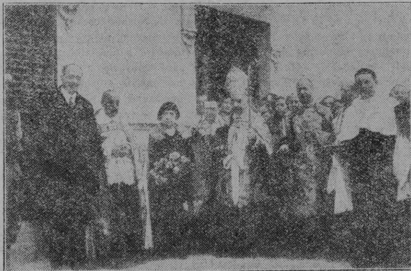
Valencia. — El arzobispo bendiciendo el nuevo barrio obrero de San José, que ha sido inaugurado con gran solemnidad.

Las fiestas no se limitarán exclusivamente al día 22 de febrero, sino que se prolongarán desde esa fecha hasta mediados del mes de noviembre. "Para asegurar el éxito del variado y extenso programa, se tiene en proyecto concertar las festividades geográficas