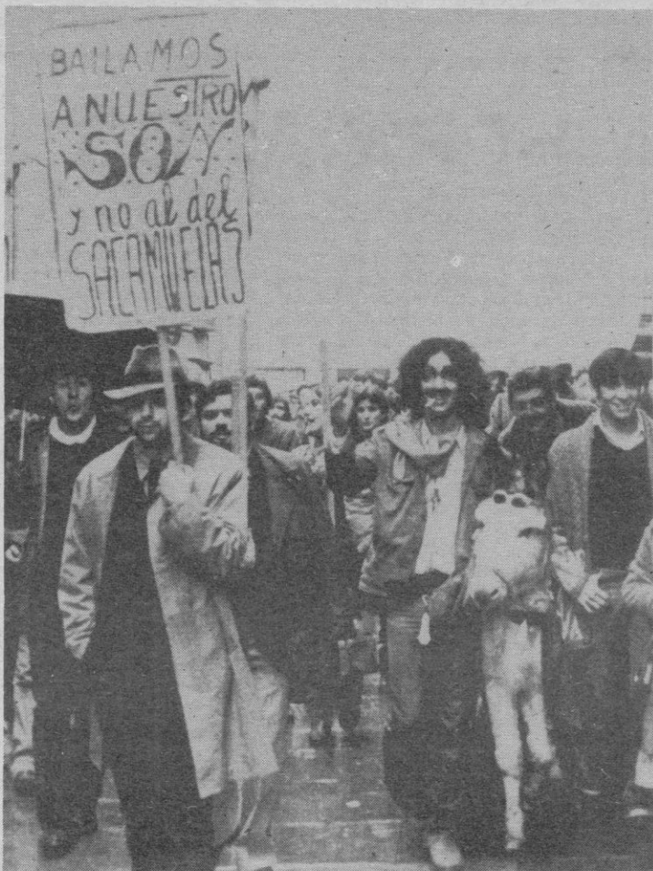
SANTIAGO DE COMPOSTELA.— Grupos de estudiantes se manifestaron en las calles santiagoñas como réplica al Festival Internacional de Tunas, que estos días se celebra en la ciudad santiagoña.