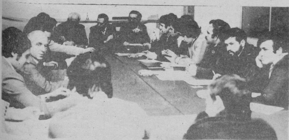
La negociación en su sexta reunión, la fotografía muestra la primera de ellas, ha sido abandonada por UGT y USO.

CC. OO. continúa sólo, proponiendo una banda salarial que las otras centrales no han aceptado