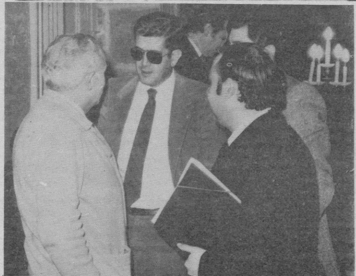
No buenas caras presentaban en el pleno de ayer los concejales que vuelven al Ayuntamiento.