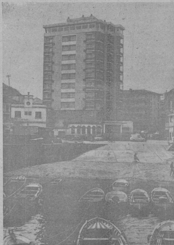
Un bello pueblecito asturiano de la costa: Candás. Su pintoresquismo natural se incrementa con las corridas de toros que suelen celebrarse en la arena de su playa.