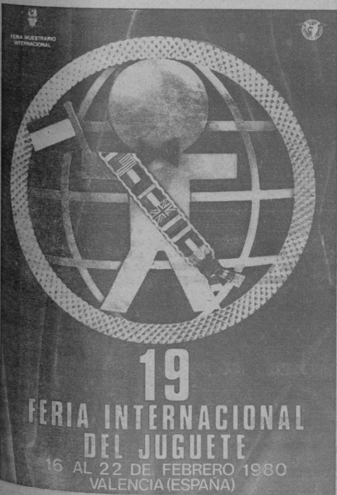
Este es el cartel anunciador de la Feria Internacional del Juguete del próximo año.

Cinco miembros del comité pro-liberación de Javier Rupérez se trasladarán hoy al País Vasco para examinar la situación en torno al secuestro del diputado de UCD y captar el ambiente en la zona, según comunicó a Efe uno de los miembros del comité.