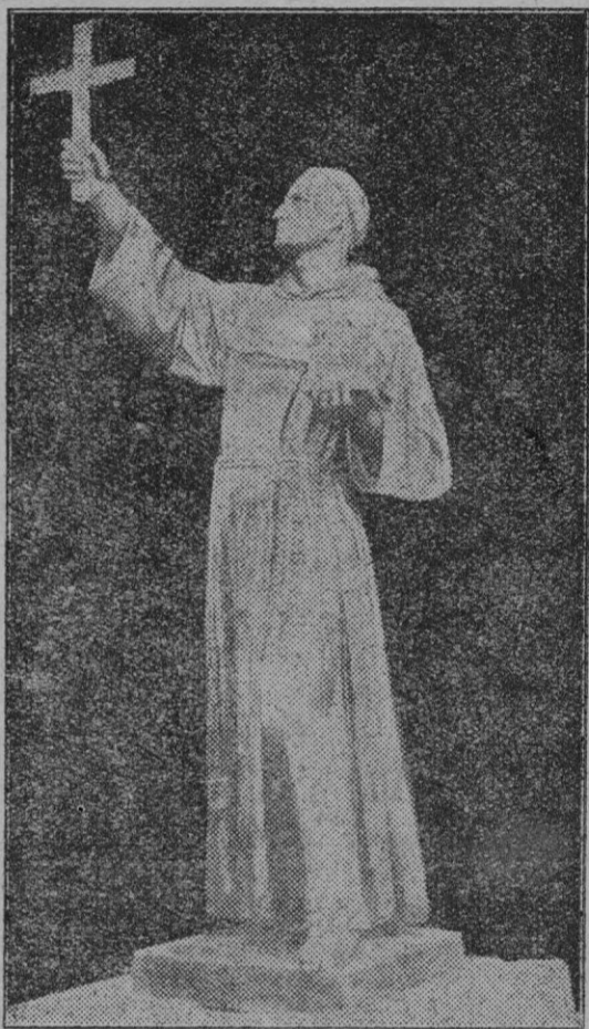
Estatua de Fr. Junípero Serra, fundador de la primera misión española en California, que será colocada en el "Hall de las estatuas" del Capitolio, de Washington.

ria. El día 2 de noviembre del año 1749 arribaba al puerto de Veracruz, de donde partió inmediatamente con sus ocho compañeros para Sierra Gorda. En Santiago de Xalpán estudió el idioma de los nativos, para atraerlos a la fe católica. Su fruto de conversión fué aquí maravilloso, como en todos los demás poblados de la Nueva España. En 1767, Fray Junípero partió para California. La primera rada que tocó este ilustre franciscano fué la de Loreto, donde el Señor bendijo visiblemente sus fatigas apostólicas; así es que, en menos de dos