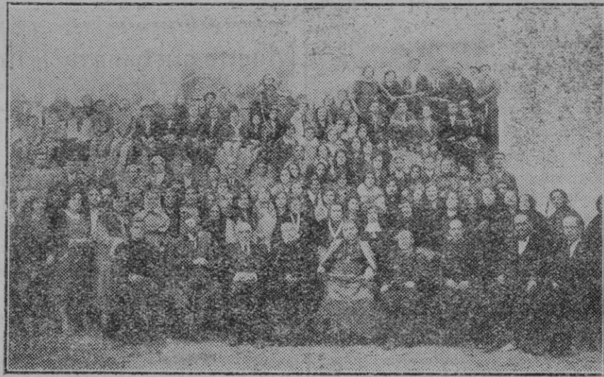
Ibiza. — Grupo de ejercitantes que asistieron a la bendición de la bandera, presididos por el Ilmo. y Rvmo. Sr. Obispo de la diócesis.

De Marsella llegó el vapor francés "Djemila", el cual salió para Argel de donde es esperado mañana.