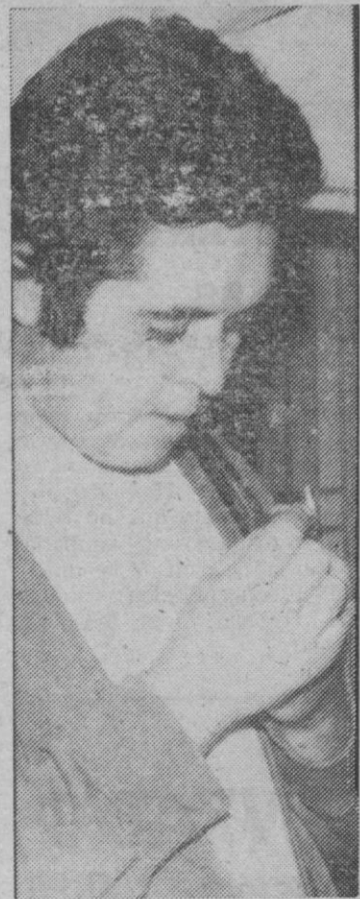
«Me parece maravilloso poder exponer en la iglesia de San Millán»

—Sí; creo que al igual que otras características pueden formarte un carácter o una forma de ser, en pintura ocurre exactamente lo mismo, ya que es una expresión de lo que sientes. De esta manera los colores y la forma de pintar se hacen notar expresamente.