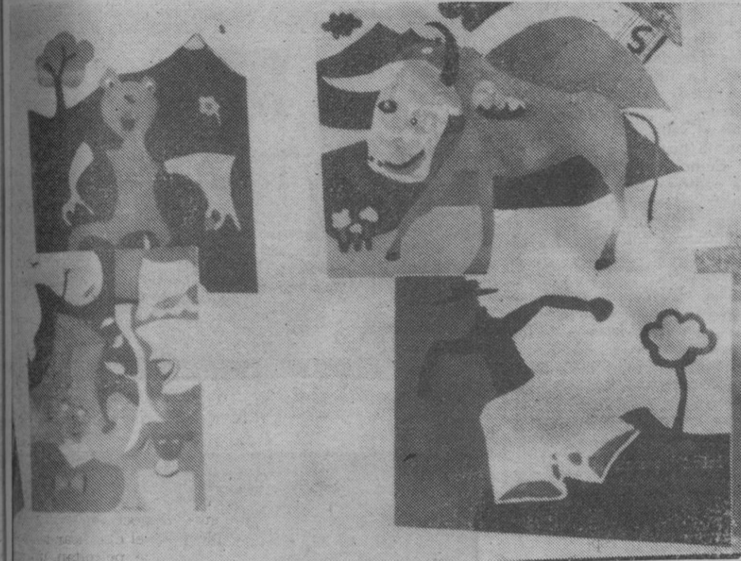
Una muestra de la obra del pintor