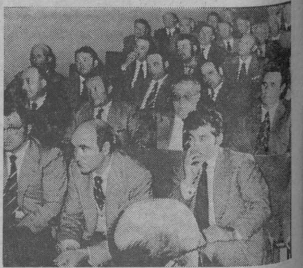
Un grupo de alcaldes y jefes de Hermandad que tomaron parte en la discusión de problemas.

Realización de estudios para la localización de