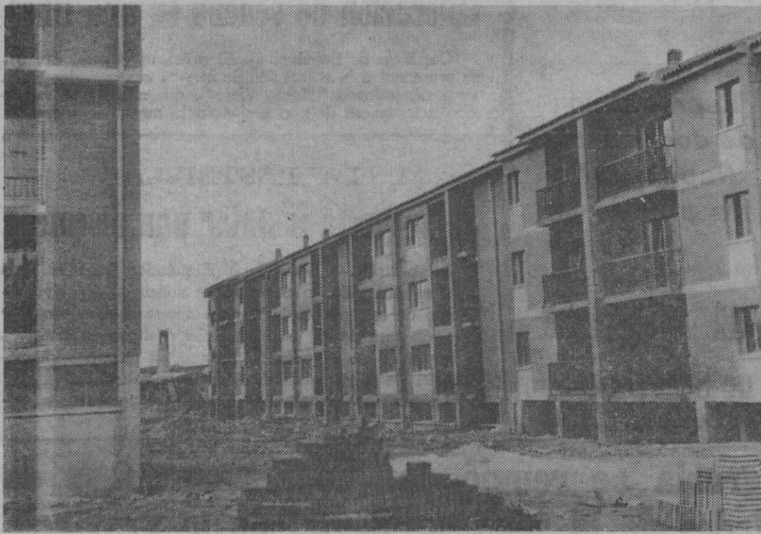
He aquí parte de las viviendas que está ultimando la Cooperativa de Viviendas "El Pinajejo", de la ciudad cantalejana, y que se espera puedan ser habitadas en fecha próxima.