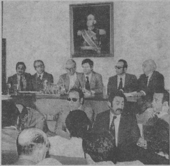
La presidencia del acto celebrado en Coca

Amplia discusión de problemas relacionados con la agricultura, ganadería, aprovechamientos forestales, etc.