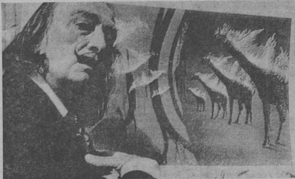
La última de Dalí: «Jirafas llameantes». Así titula él a su último lienzo. En París ha expuesto un plan para prender fuego a modelos de jirafas, en el puente de Avignon, el 22 de junio, en exhibición de fuegos artificiales para celebrar el Festival del Río Rhone.