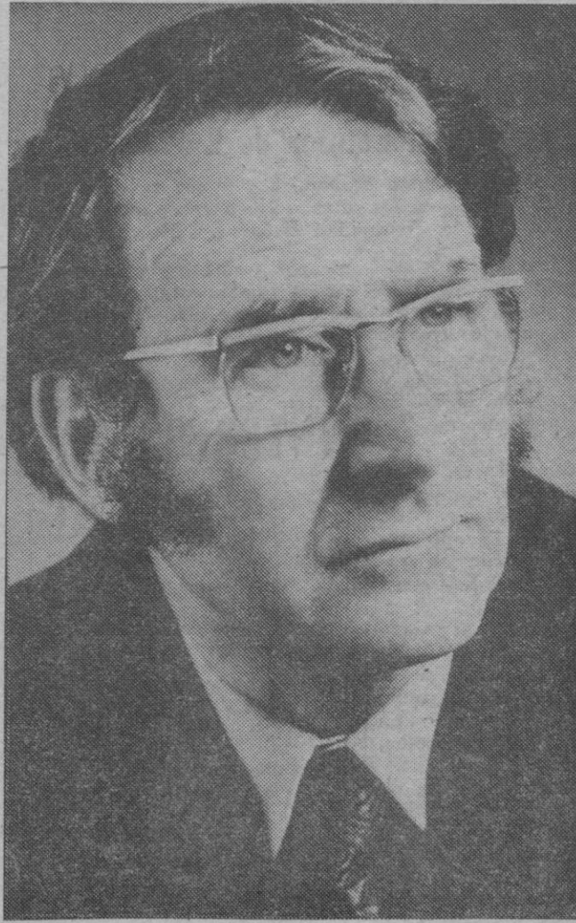
Nadine Gordimer y Stanley Middleton, que han compartido el Premio Booker a la Ficción

El hecho de que el Premio Booker a la Ficción para 1974, dotado con 5.000 libras esterlinas, fuera compartido por dos novelas, no ha de sorprender a nadie. Hubiera sido una tarea casi imposible para los tres miembros del jurado decidir entre los eventuales conjuntos: "The Conservationist" de Nadine Gordimer, y "Holiday" de Stanley Middleton, porque eran obras enteramente distintas.