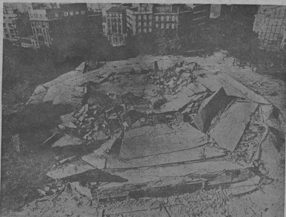
Después de un retraso de cinco horas, la voladura del mercado de Olavide, en Madrid, prevista para las 9 de la mañana del pasado sábado, se realizó a las 13 horas. Con ella «murió» el antiguo edificio, envuelto en una gigantista polvareda.