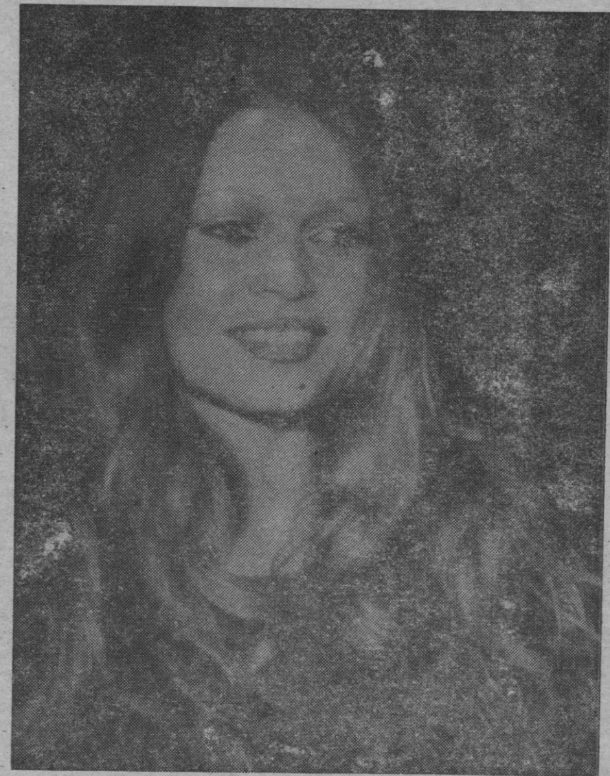
Brigitte Bardot, o más breve B. B., ha cumplido no hace muchos días los cuarenta años de edad y parece ser que ahora, según sus propias declaraciones, ha decidido tomar la vida en serio.