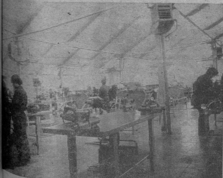
Industrialización puede y debe ser uno de los factores más sugerentes de desarrollo segoviano

¿Sobre qué pilares cree que debiera asentarse nuestra economía y cuáles cree usted que son actualmente los puntales que habría que reforzar?