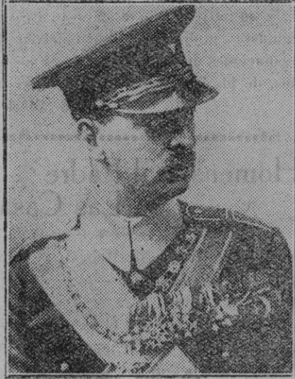
Bucarest.—El príncipe Carlos que ha sido proclamado Rey de Rumania.