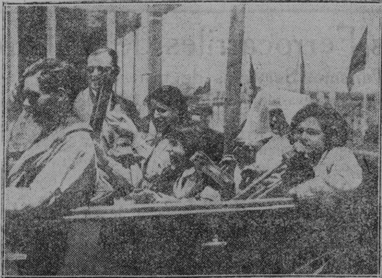
Barcelona.—Niñas lisiadas del Asilo de San Rafael a las que la Federación de Taxistas de Barcelona condujo gratuitamente a visitar la Exposición y a las cuales la Juventud Hotelera les obsequió con un almuerzo