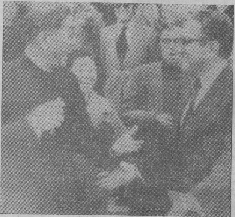
Durante su estancia en China, Kissinger ha visitado el llamado templo del Cielo, acompañado del vicepresidente de la República Popular China, Chia Kuan Tua. Kissinger dijo durante la visita: «Todos nuestros problemas podemos resolverlos aquí»