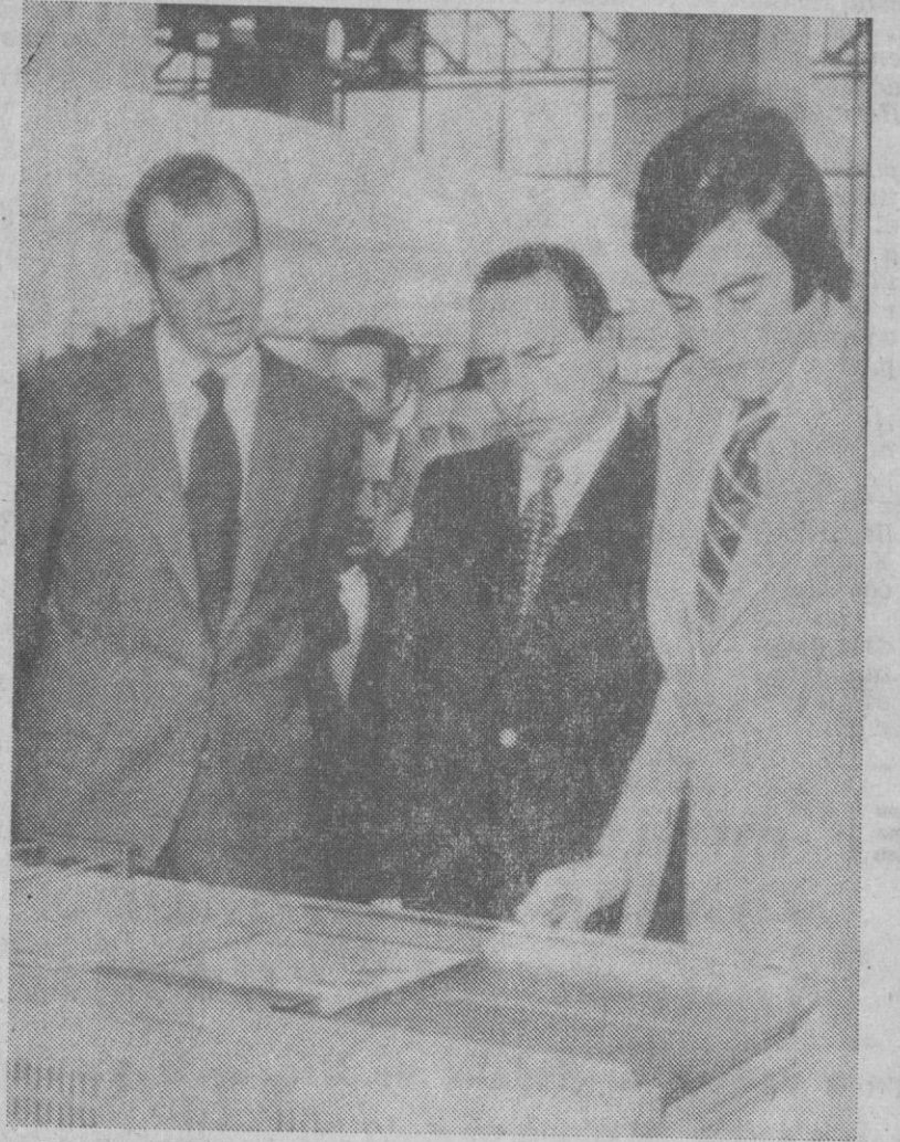
El Príncipe de España, en un momento de su visita al S.I.M.O., certamen anual sobre material de oficina. En la fotografía, don Juan Carlos escucha las explicaciones de los técnicos sobre el funcionamiento de una de las máquinas allí exhibidas