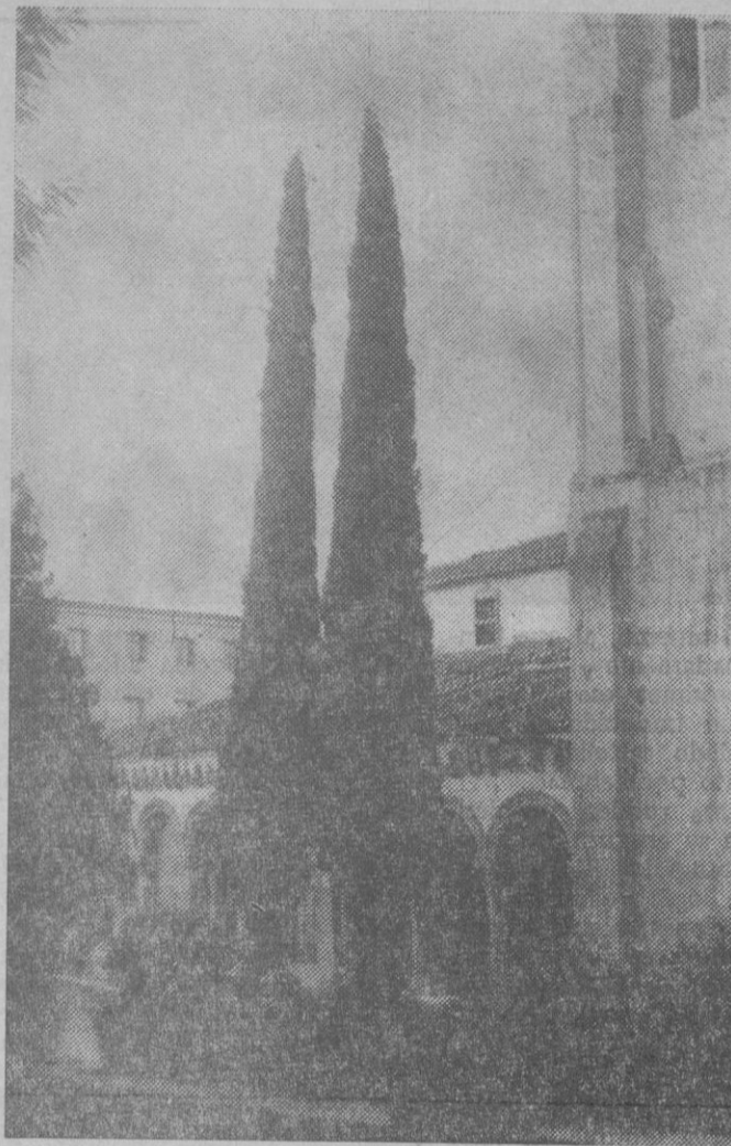
Las «heridas» que se les han originado. (Fotos F. Peñalosa).