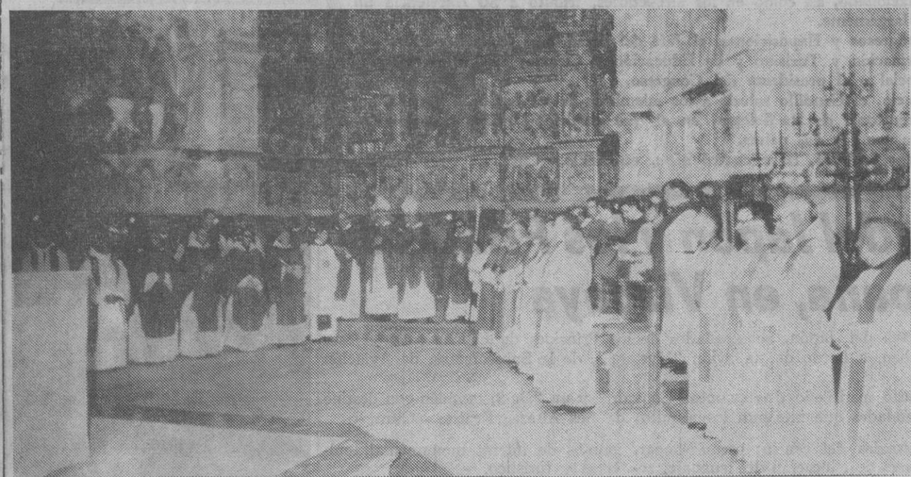
Los cuarenta concelebrantes, ante el altar mayor del monasterio, durante la santa misa

A la caída de la tarde, fue encendida la iluminación del monasterio.