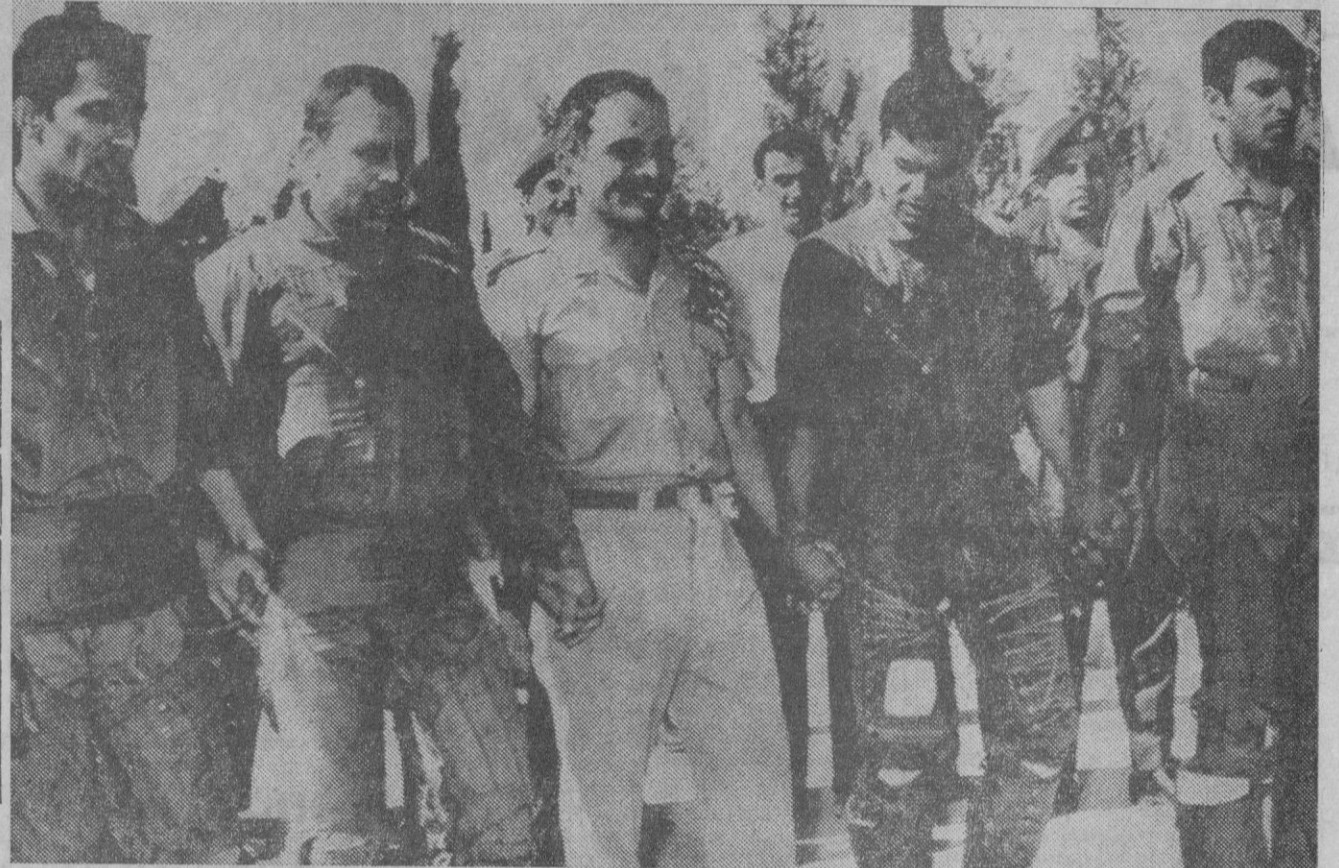
Jordania, según las informaciones de prensa difundidas, ha entrado en la guerra árabe-israelí, aunque todavía no se concrete mucho su ayuda. En la fotografía el rey Hussein junto a algunos mandos militares en una celebración patriótica.

EE. UU., dispuestos a reponer las graves pérdidas israelíes de aviones y tanques. Se estiman en 100 y 650 unidades, respectivamente, y cohetes destruidos por la eficaz acción de los misiles soviéticos. Continuaron la ofensiva israelí en la carretera de Damasco y la ofensiva egipcia en el Sinaí