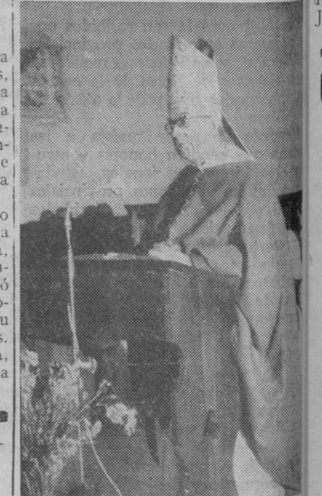
El cardenal Enrique y Tarancón durante la homilía