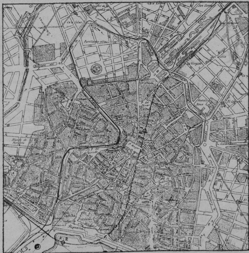
1. Entrada en la calle del Marqués de la Fuensanta. — 2. Entrada abierta en la muralla. — 3. El trayecto. — La línea de rayitas señala el curso del túnel y la línea negra marca el actual trayecto del ferrocarril que va de la Estación al muelle atravesando la ciudad por la Rambla y el Borne.