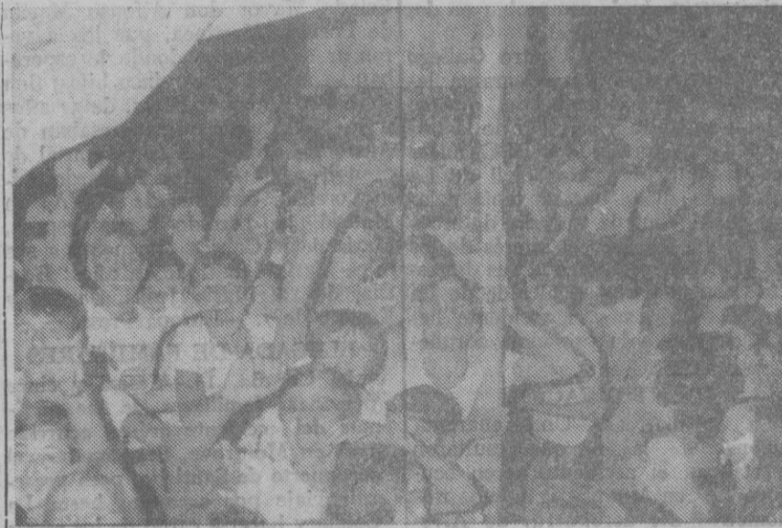
Acaban de dar comienzo las fiestas. El elemento juvenil se alborota ante el fotógrafo...