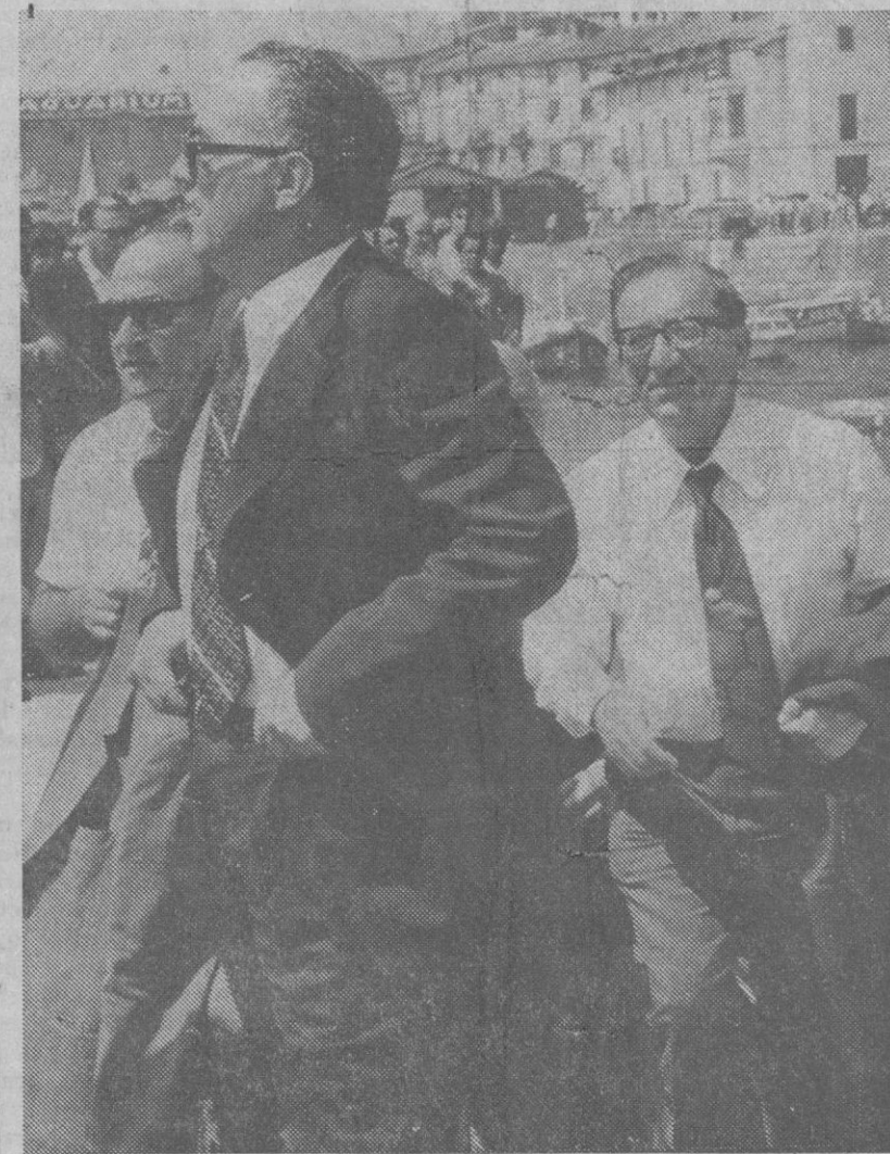
San Sebastián.—El primer ministro de Malta Dom Mintoff, durante su estancia en San Sebastián, en viaje oficial. Mintoff se entrevistó en varias ocasiones con el ministro español de Asuntos Exteriores, don Laureano López Rodó sobre asuntos que conciernen a las relaciones entre ambos países.—(Foto Europa Press).