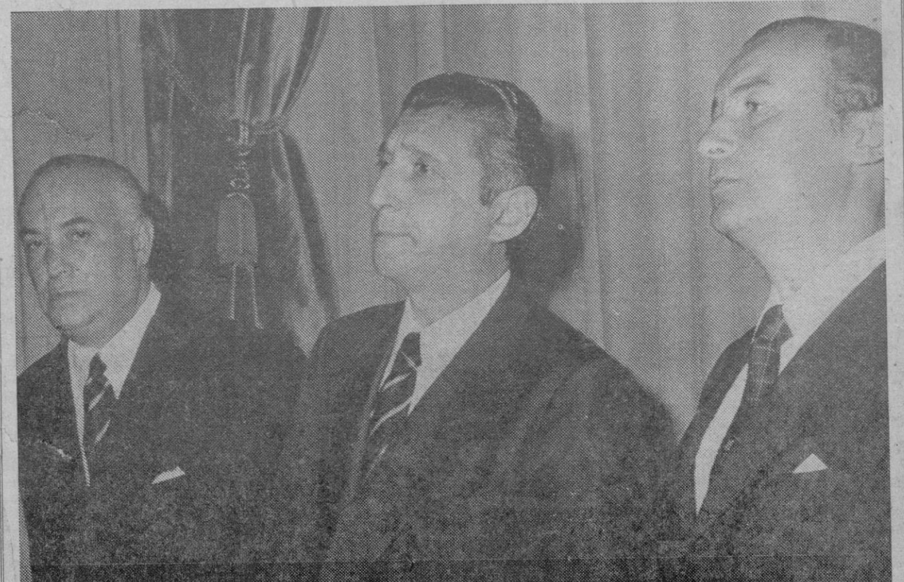
Madrid.—Ha tomado posesión de su cargo como subgobernador del Banco de España, don Nemesio Fernández Cuesta. Presidió el acto el ministro de Hacienda, señor Barrera de Irimo.