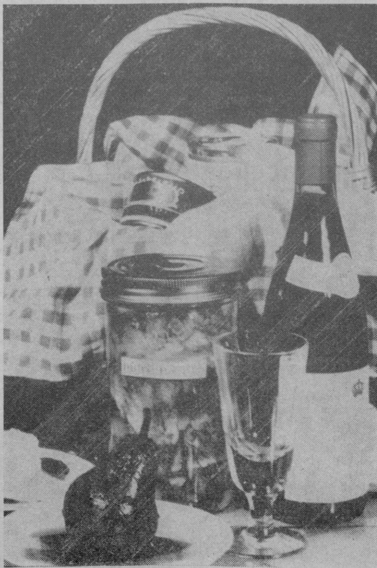
En las tiendas especializadas en dietética se encuentran muchos productos «biológicos».

Las langostas son consideradas un bocado exquisito por los aldeanos de la región, pero en este caso desatendieron las advertencias de las autoridades, en las que se indicaba que numerosas zonas de dicho territorio habían sido tratadas con insecticidas a fin de eliminar a las langostas.—Efe-Reuters.