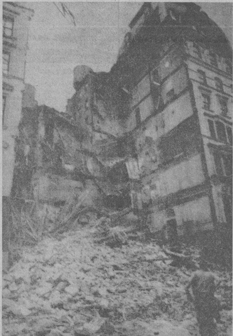
Sin que se sepan aún las causas que provocaron la explosión y el derrumbamiento del hotel más antiguo de la ciudad, el Broadway Central Hotel, los bomberos buscan entre los escombros las posibles víctimas del espectacular accidente.

Tanto si se trata de "health-food" o de productos cultivados según los métodos agrobiológicos, las ventajas son clarísimas, a condición, naturalmente, que tales productos sean lo que pretenden ser... pues también comienzan a producirse abusos en este dominio. Ciertos artículos caros y presentados con mucho lujo no son forzadamente "biológicos". Las amas de casa no deben dejarse engañar y tienen que exigir siempre las debidas garantías.—(Copyright Fiel-Servicios Especiales de Efe-France Presse).