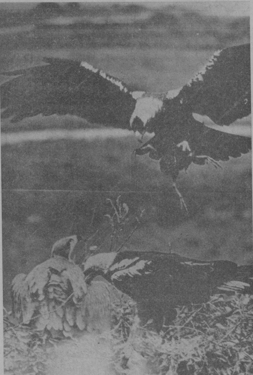
Nido de águilas imperiales, hasta el que puede llegar también el veneno mortal en los alimentos que las aves llevan a sus crías.

¿Cuántas de nuestras bellas águilas dejan de cruzar nuestros cielos cada día que pasa? El incomprendible águila real, símbolo de poderío; estandarte de naciones desde tiempos muy remotos; ave fénix de la naturaleza, no puede tampoco librarse de la desencadenada lucha a muerte. Es bien sabido que las águilas, eminentemente cazadoras, no desdennan nunca la carroña por constituir un fácil alimento. Del águila real, de la que recientemente un grupo de científicos y ornitólogos han hecho un estudio, apenas se cuentan actualmente, en España, unas 50 parejas. «Lo triste es que esta especie, patrimonio nacional, se encuentra extinta en el resto del mundo. Sin embargo, ni la belleza de estos animales, ni el ser reliquia de otros tiempos, les sirve para sobrevivir al veneno.