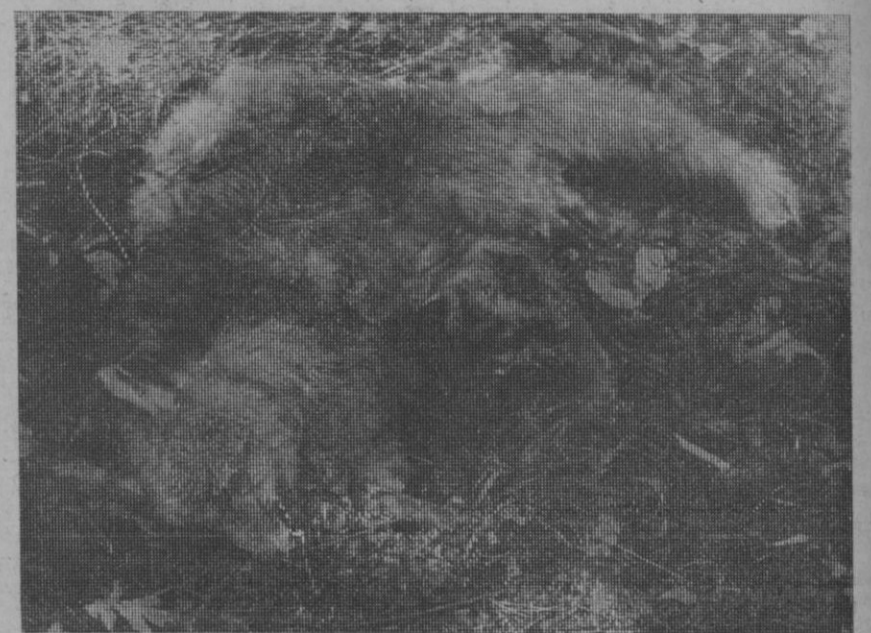
Un zorro ha muerto envenenado, víctima de la cadena de destrucción. En el momento de la fotografía, llevaba muerto más de un mes dentro de una finca.

cia de veinte kilómetros los restos de carne envenenada. Muchos de los que habitan en la ciudad tienen sus lugares de comida fuera de ella. En la sierra u otro lugar. Desde allí pueden traernos el veneno. Quien dice aquí, dice a cualquier otro pueblo. Las urracas y los cuervos contribuyen a la propagación de los devastadores efectos. En cualquier lugar aparece una bola envenenada que se utilizó a muchos kilómetros de distancia. Los cadáveres de estas aves son devoradas por otros animales, y en otro alejado lugar comienza, de nuevo, la cadena de la muerte.