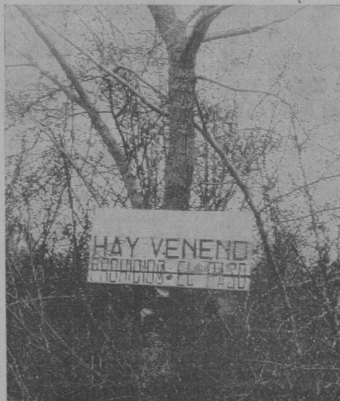
Carteles como este aparecen en gran abundancia por numerosas fincas en la infinidad de nuestros campos

Tampoco aquí para el huracán de muerte levantado. Por si fuera poco lo anteriormente dicho, las aves carroñeras transportan las bolas de carne, los huevos o los restos de animales envenenados a insospechados lugares. Las grajillas, por ejemplo, pueden llevar a una distan-