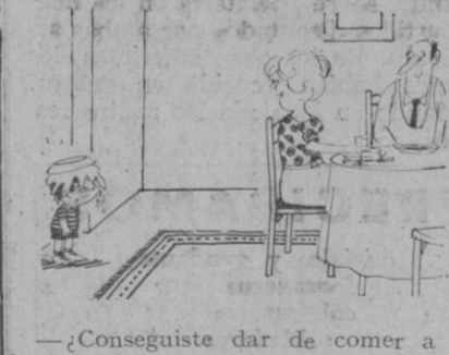
—¿Conseguiste dar de comer a tu hermana?

SU RELOJ... ROAMER Auténtico sumergible BAYON Cervantes, 1 - Teléfono 411647 (Esta casa no tiene sucursales)