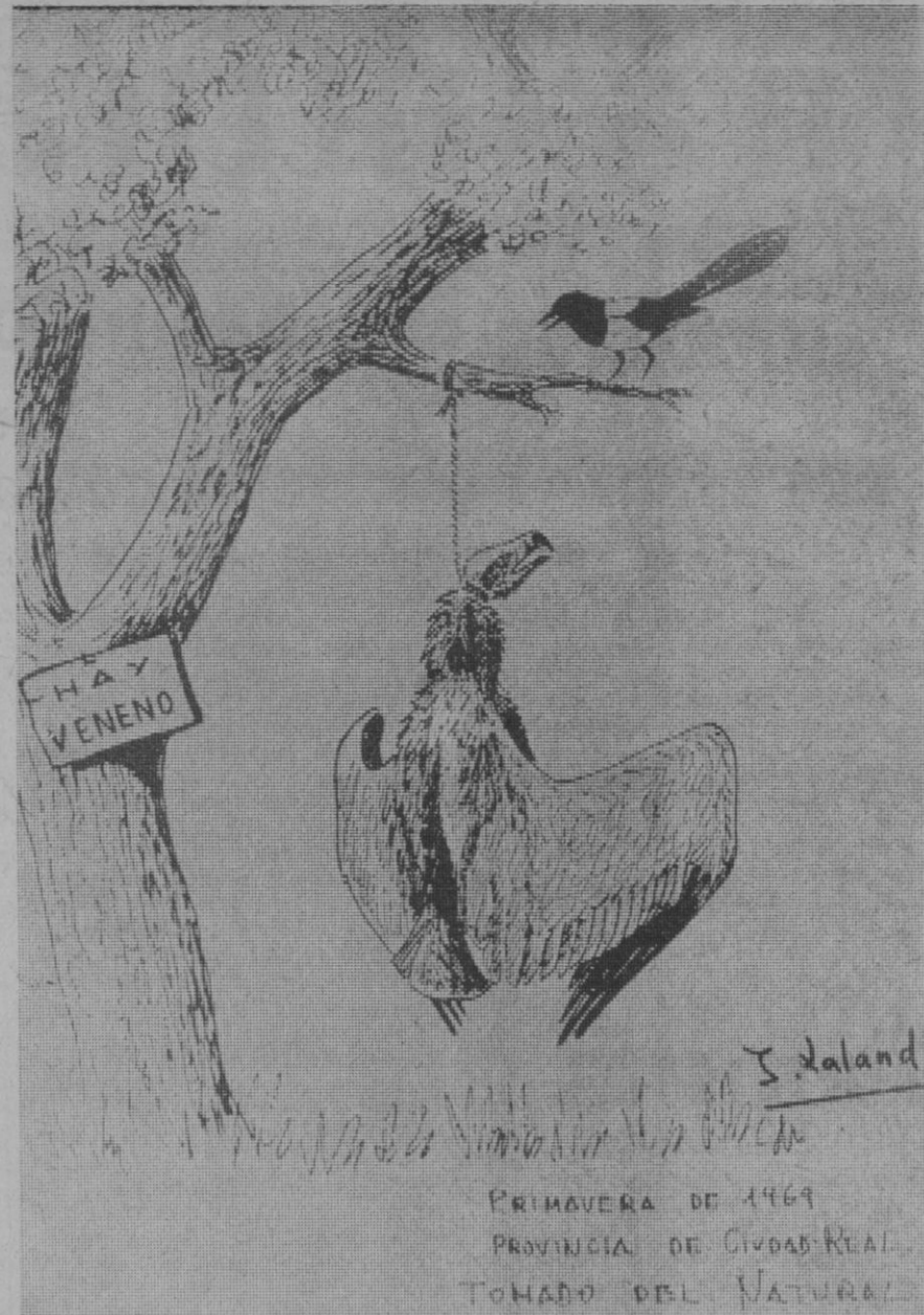
Buitre negro, víctima de la ignorancia y de la actitud destructora del hombre.