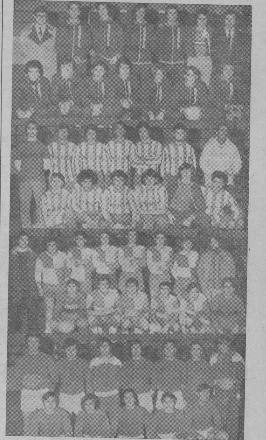
De arriba a abajo, equipos de Madrid, Tenerife, Valladolid y Segovia.

Valladolid: Fraile (Fernández), Diego (2), Arriaga, Justiniano (1), Del Amo (5), De Hoyos (3), Rami-