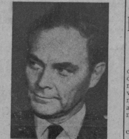
El general Alexander M. Haig, enviado del Presidente Nixon, quien estudia en Vietnam la posibilidad de reanudar las conversaciones de paz

Consejo del Plan Nacional de Higiene y Seguridad en el Trabajo "Las prendas de protección te evitarán la lesión en caso de accidente. Trabajador: Utilízalas siempre".