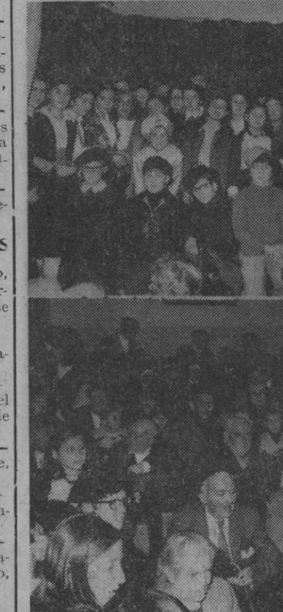
Ayer tarde, en la residencia de las Hermanitas de los Pobres, los «scouts» segovianos, chicos y chicas, dedicaron una simpática fiesta a los residentes en el mencionado centro. Hubo bailes, canciones y teatro, actividades en el que participó el nutrido grupo de «scouts» que figura en la fotografía superior. En la inferior, un aspecto del salón donde se celebró el acto.