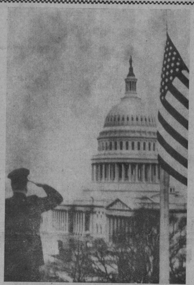
Washington.—Un oficial de la policía saluda a la bandera norteamericana después de haberla colocado a media asta en memoria del expresidente Harry S. Truman, que falleció a los 88 años de edad.

Consejo del Plan Nacional de Higiene y Seguridad en el Trabajo "Las prendas de protección te evitarán la lesión en caso de accidente. Trabajador: Utilízalas siempre".