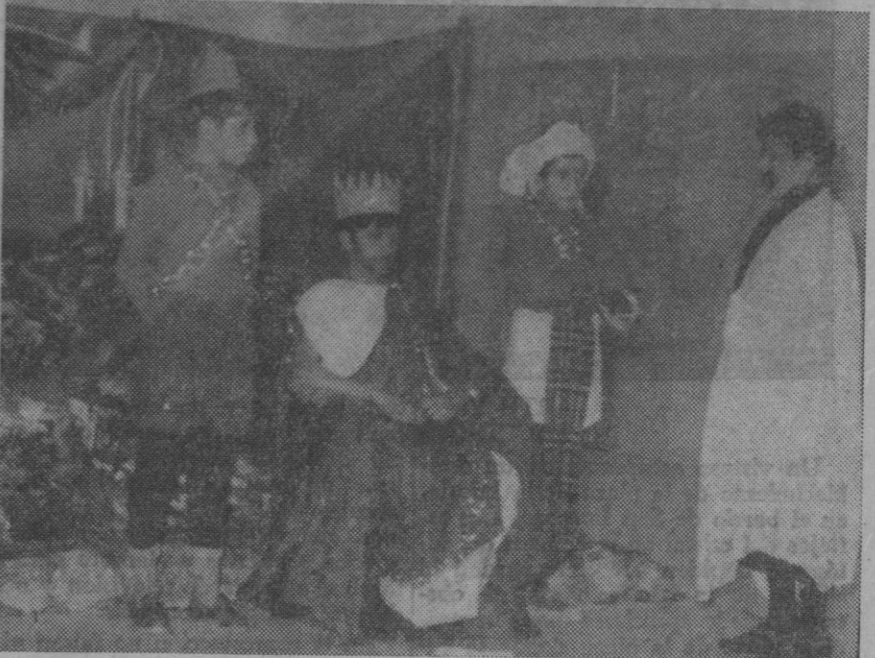
Una escena de la velada ofrecida en el colegio nacional comarcal de Cuéllar.

Cuéllar.—Con motivo de las fiestas navideñas, se celebró en el colegio nacional comarcal un acto lleno de alegría y solidaridad entre profesores y alumnos. Reunidos todos en el salón de actos y teniendo como fondo un bello belén, obra de los propios alumnos dirigidos por sus profesores, comenzaron las representaciones teatrales. En primer lugar una alumna del centro dirigió unas palabras a sus compañeros y enalteció la labor del profesorado, esa cotidiana tarea de formarlos intelectualmente, física y moralmente, dándoles las gracias por tantos bienes de ellos reciben. A continuación se representaron las obras «La estrella de Oriente» y «La Nochebuena de Belén», donde los pequeños artistas hicieron gala de una delicada preparación y una capacidad fácilmente visible. Una serie de villancicos interpretados maravillosamente por el coro del centro y la adoración al Niño Dios dieron fin a estas representaciones. Finalmente, don Pedro Martín Adeva, director del centro, dirigió unas palabras de felicitación a los participantes de las diferentes actuaciones, haciéndoles ver la gran impor-