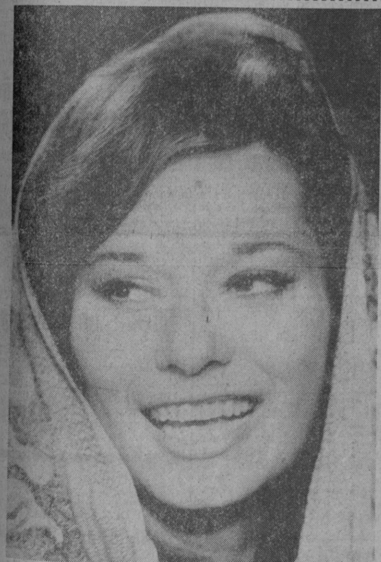
Lea Massari interpreta un papel en «La mujer azul», de Michel Deville. «Cuando interpreta Lea Massari—dice éste—es un espectáculo por sí misma». Es genial, añade. Todo lo que hace como actriz es imprevisible.

Cádiz, 27.—Se tienen noticias de que en unos cortijos del término de Medina Sidonia (Cádiz), ha habido un tiroteo entre fuerzas de la Guardia Civil y algunos maleantes. Se sabe positivamente que dos de los maleantes han sido heridos de gravedad. Circula el rumor de que uno de los heridos es el célebre hermano de «El Lute», «El Lolo».