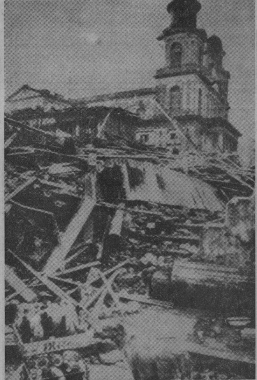
Un primer plano de los efectos de la catástrofe de Managua, con un grupo de viviendas derruidas