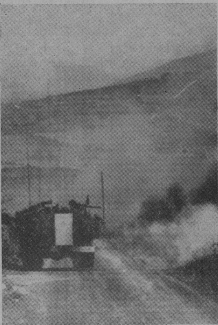
Región sur del Líbano.—Tropas israelíes atravesaron la frontera del Líbano en una incursión contra campamentos de guerrilleros y aldeas libanesas. Fuerzas del ejército del Líbano opusieron resistencia.