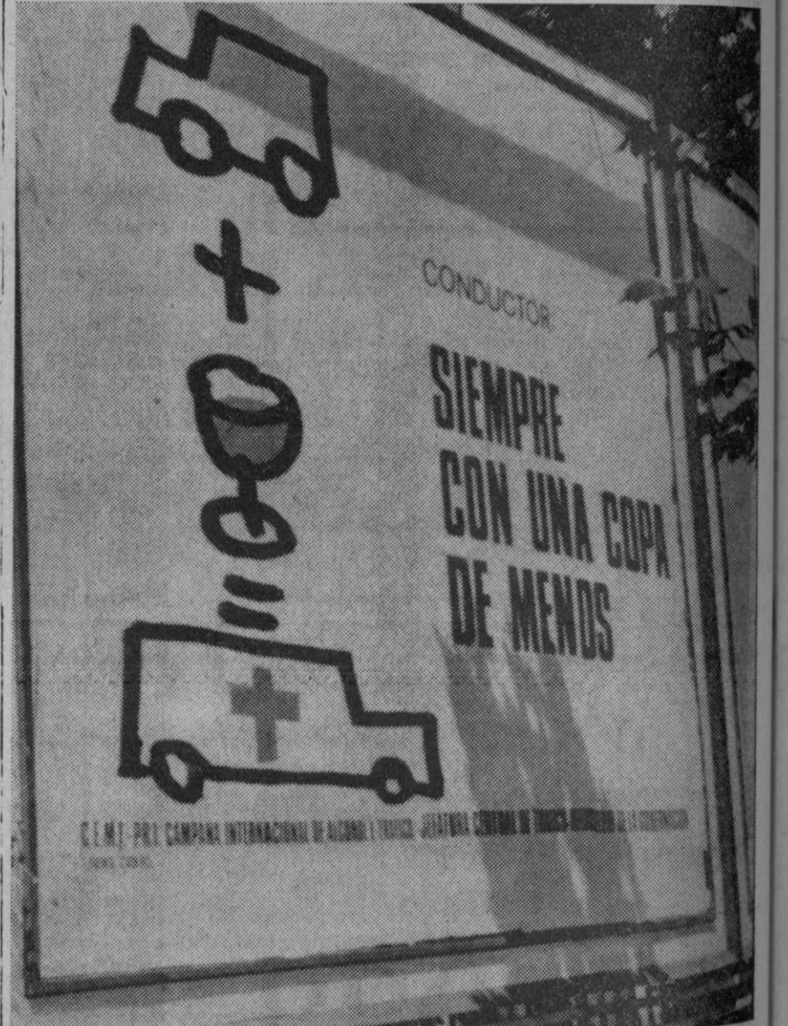
Cada semana nos trae un trágico balance de muertos y heridos cobrados en el silencioso campo de batalla de la carretera. El exceso de velocidad y el alcohol aumentan la peligrosidad de un automóvil manejado con mente irresponsable. De ahí que la Jefatura Central de Tráfico haya iniciado una nueva campaña encaminada a despertar la conciencia de los conductores para que se percaten del enorme peligro que supone una copa de más a la hora de sentirse al volante.—(Cifra)

Estas laboriosas negociaciones se celebran en la Comisión de Fondos Marinos, de la Asamblea General.