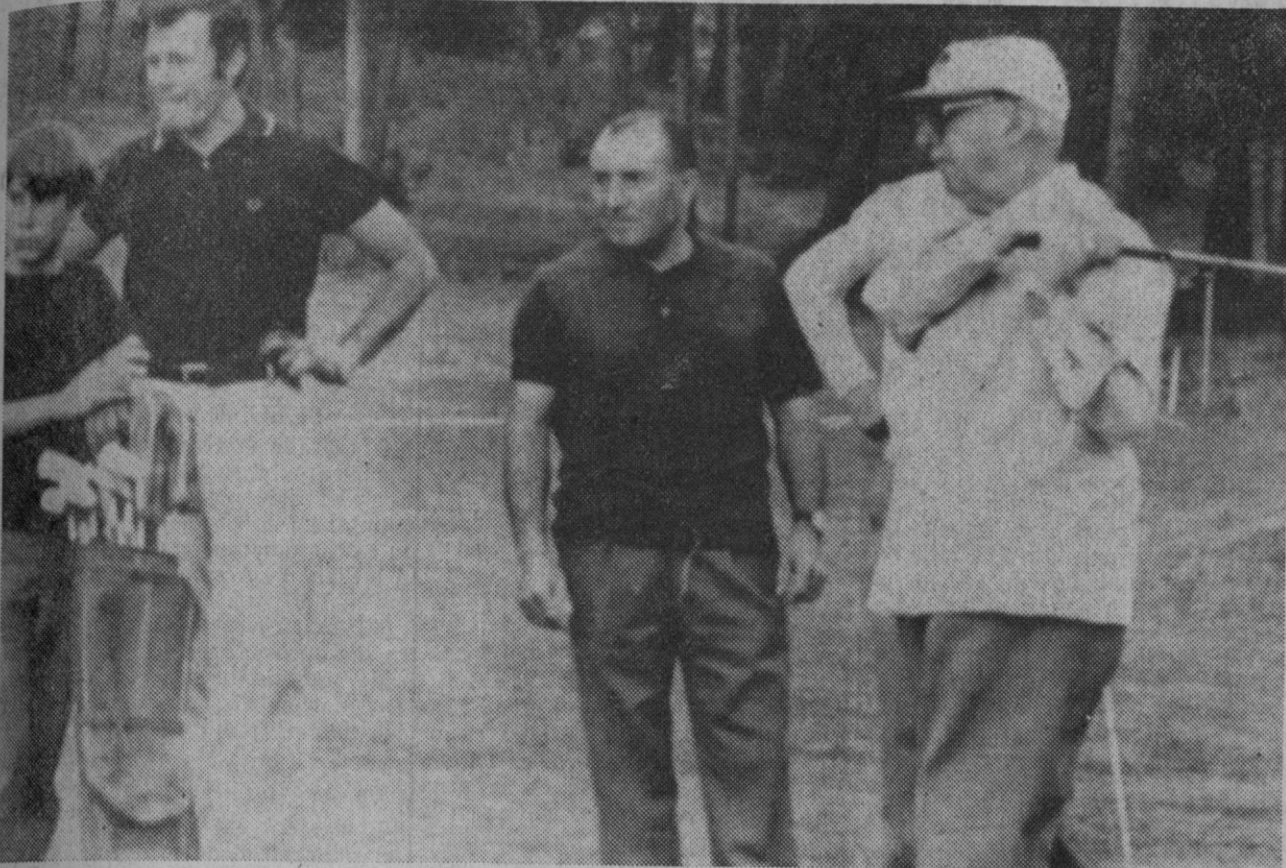
La Coruña.—Su Excelencia el Jefe del Estado, acompañado del Príncipe don Alfonso y del señor Guimaraens en el transcurso de una partida de golf en la Zapateira.