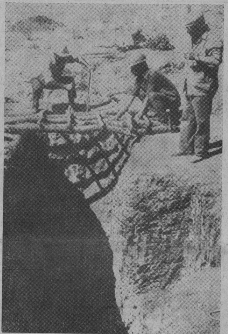
La Roca de la Sierra (Badajoz).—En la finca denominada "La Pizarrilla", término de La Roca, provincia de Badajoz, se ha descubierto un yacimiento de plomo con un rendimiento del ochenta por ciento de plomo y un cinco por mil de plata. Se realizan las primeras extracciones casi a flor de tierra y ya se llevan sacados en una semana unos cinco mil kilos de mineral. La primera impresión es de que se trata de un yacimiento de gran importancia a escala nacional.

Amin ha aclarado que esta expulsión no tiene nada que ver con el racismo, pero sí con la economía del país que ha perjudicado al comercio de millones de negros súbditos del país como consecuencia de la competencia y obstrucción de estos asiáticos.—Efe-Reuter.