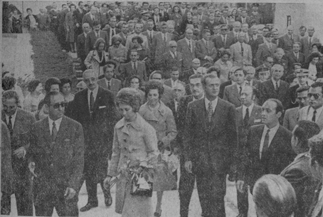
Los Príncipes de España don Juan Carlos y doña Sofía, a los que acompañaban el vicepresidente del Gobierno y varios ministros durante el acto inaugural de la IX Feria Internacional del Campo. En la «foto», los Príncipes durante su recorrido por el recinto ferial.

Esta señorita sufrió un chequeo hace una temporada pero simplemente por cuidar su salud general, ya que no había advertido molestia alguna. En la pantalla se apreció una extraña mancha junto al corazón, mancha que tenía alrededor de veinte centímetros de longitud. En vista de que, de forma externa no podía diagnosticarse la clase del extraño cuerpo, fue intervenida, encontrándose en el punto indicado el cuerpecillo de un hermano gemelo, que debió nacer con la paciente, hace 40 años y que quedó allí incrustado. El cuerpo del niño estaba casi perfectamente formado e incluso tenía algo de pelo.