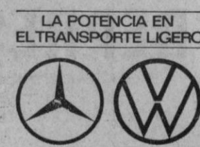
DKW F-1000 1.000 kgs. L 406 D "La nueva estrella" 2.500 kgs. L 405 D 1.700 kgs.

Concesionario: AUTO INDUSTRIAS MARTIN Avda. Fernández Ladreda, 20 - Teléfono 2844 SEGOVIA