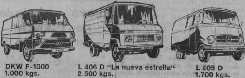
DKW F-1000 1.000 kgs.