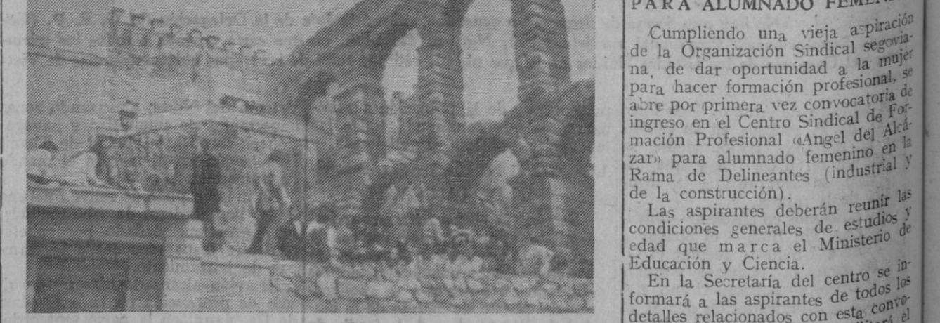
Hubo animación en la jornada de ayer del concurso de pintura al aire libre, organizado por la Delegación Provincial de la Juventud. En la fotografía, varios grupos de chicas y chicos dibujando sobre el pretil de la terraza de Santa Columba.

¿Se casa por la tarde? consulte a DUQUE su banquete o lunch nupcial