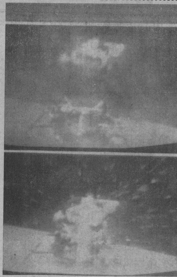
Momento en que el módulo lunar enciende su motor y despega de la Luna para dirigirse hacia el módulo piloto donde Mattingly esperaba a Duke y Young.