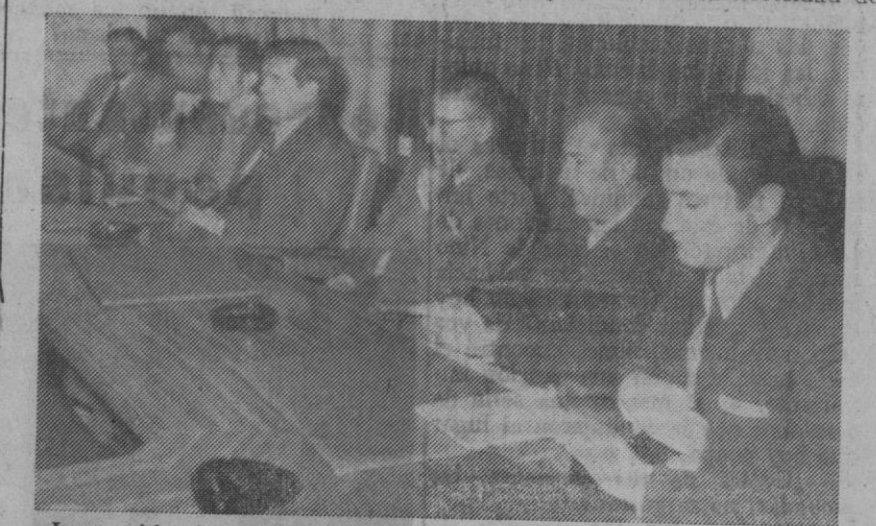
La presidencia en el acto constitutivo del Sindicato Provincial de Vidrio y Cerámica.