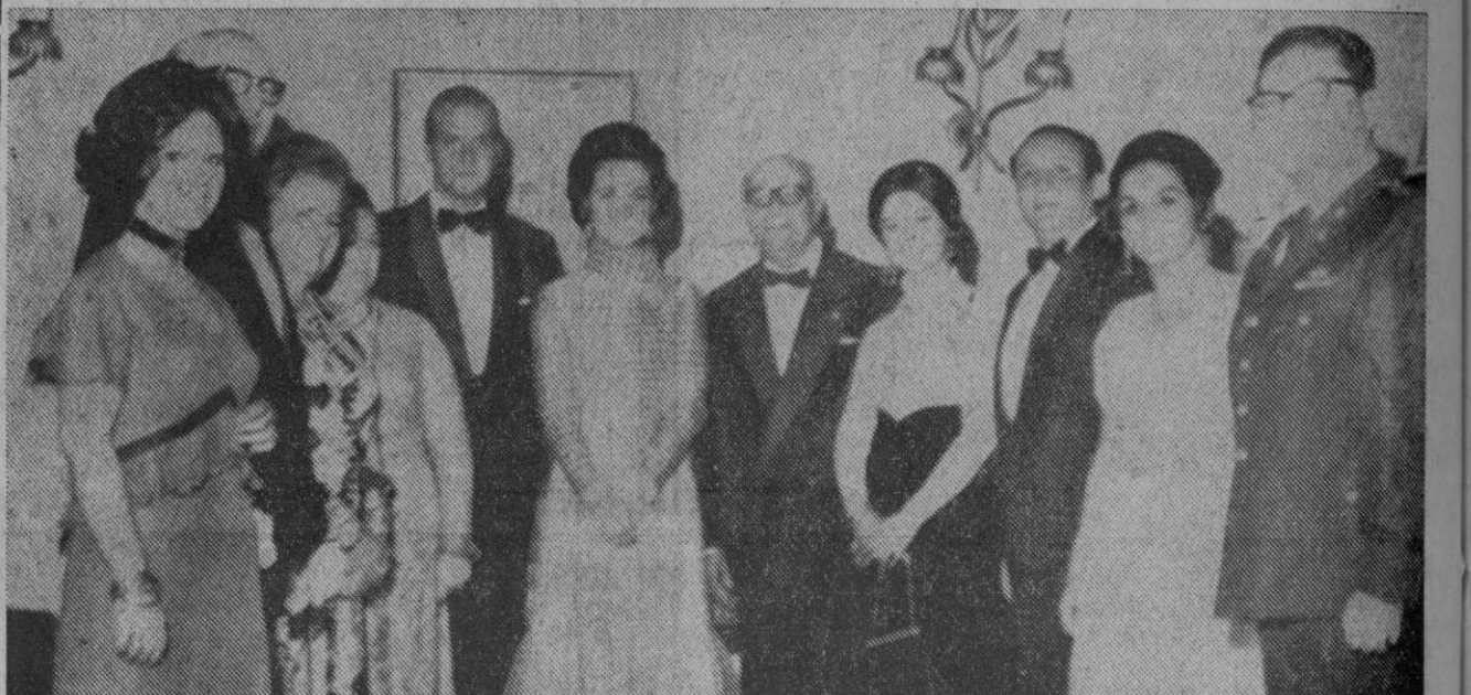
En la Cancillería de la República de Nicaragua en Madrid les fue ofrecida una cena a los Príncipes de España, don Juan Carlos y doña Sofía de Borbón; al acto asistieron además del ministro español de Asuntos Exteriores, los miembros de la misión diplomática de Nicaragua en España y numerosas personalidades.

En College Park, la guardia nacional seguía anoche protegiendo la Universidad de Maryland, escenario de las más violentas confrontaciones entre policías y manifestantes, en esta semana.—Efe.