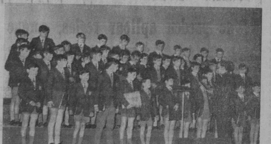
Tuvo ayer lugar el concierto de la Sociedad Filarmónica correspondiente al mes de marzo, que estaba a cargo de la Escolanía de la Basílica del Valle de los Caídos, y que se celebró en el teatro Juan Bravo, con gran asistencia de público a las ocho de la noche.