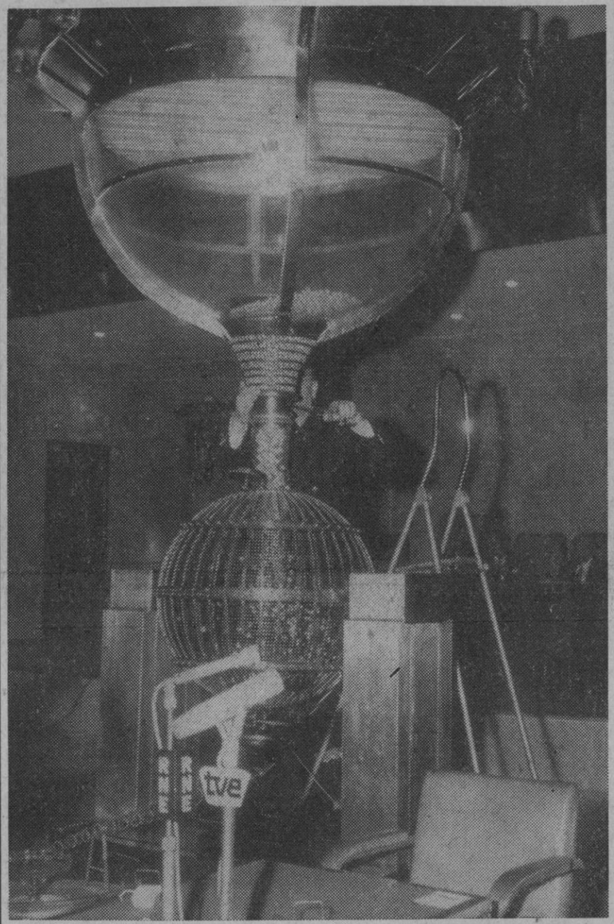
He ahí el bombo de los premios del sorteo de hoy, con toda su carga de millones de pesetas. De él ha salido la realización colmada de ilusiones cumplidas para muchos. Para los más, la desilusión, castillos en el aire que se esfuman una vez más. Pero, eso sí, con la esperanza de que «otra vez será».