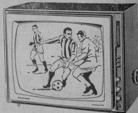
19 TE 395A