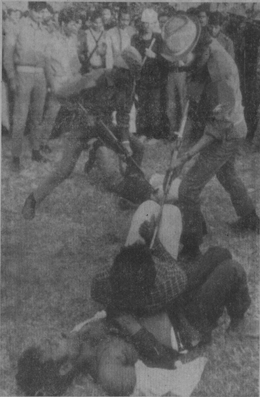
Dacca.—Un miembro de la Mukti Bahini (guerrilleros bengalíes) clava su bayoneta en el cuerpo de una de las víctimas tras la ejecución en Dacca el pasado 18 de diciembre, mientras la multitud les contempla impertérritos. En el suelo varias víctimas de estas ejecuciones.

VER Y SER VISTO.—Encienda sus faros inmediatamente que se ponga el sol, o incluso antes, si la visibilidad es poca. El conductor necesita ver y ser visto.