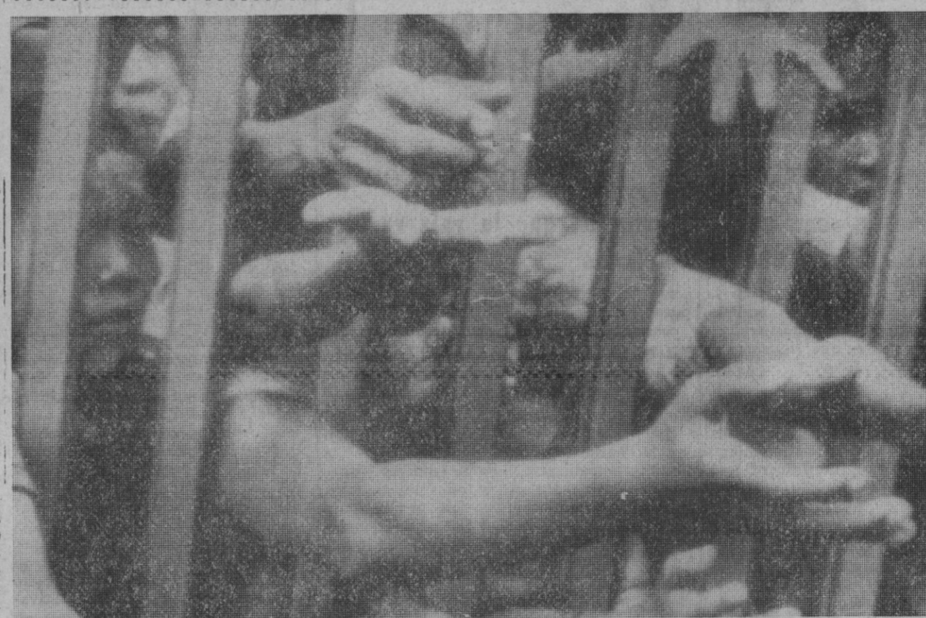
Yakarta (Indonesia).—Pobres, gentes sin hogar y sin patrimonio, se agolpan ante las verjas del palacio presidencial de Yakarta, en demanda de la tradicional oferta de arroz del presidente a los pobres en la festividad musulmana de Idul Fitri.