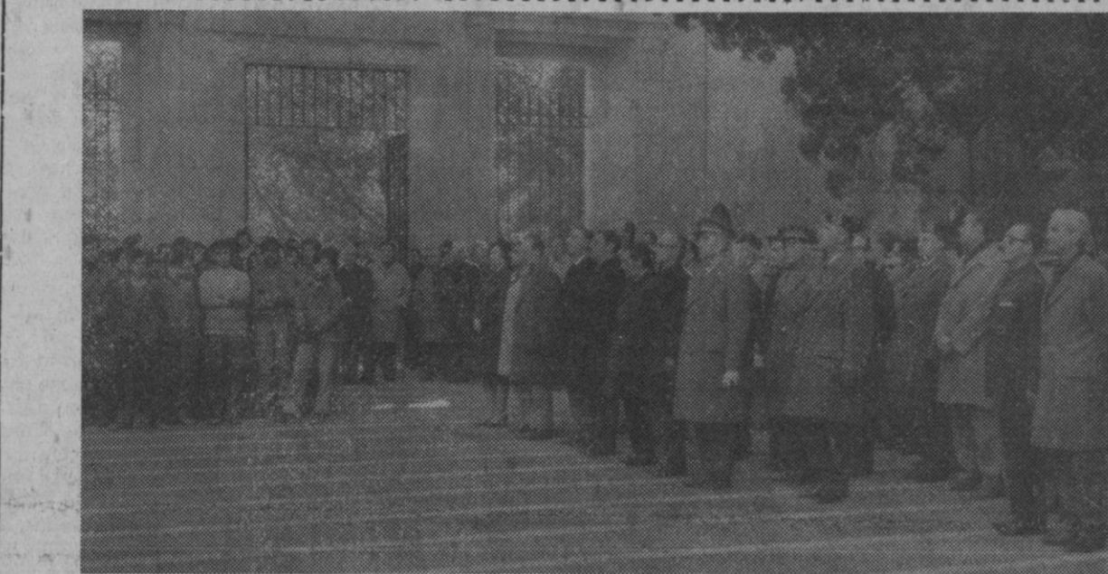
Se ha conmemorado esta mañana en Segovia, según informamos en la sección de local, el «Día de José Antonio y de los Caídos». Entre los actos celebrados, ha tenido lugar el de ofrenda de coronas ante el monumento a los caídos, a uno de cuyos momentos corresponde esta foto.

sa de las Cortes, Consejo Nacional, Vieja Guardia, etcétera. Finalizada la ceremonia religiosa se entonó un responso y seguidamente el Caudillo, acompañado del Príncipe abandonó el templo, bajo palio, siendo despedido con los mismos honores que a su llegada.