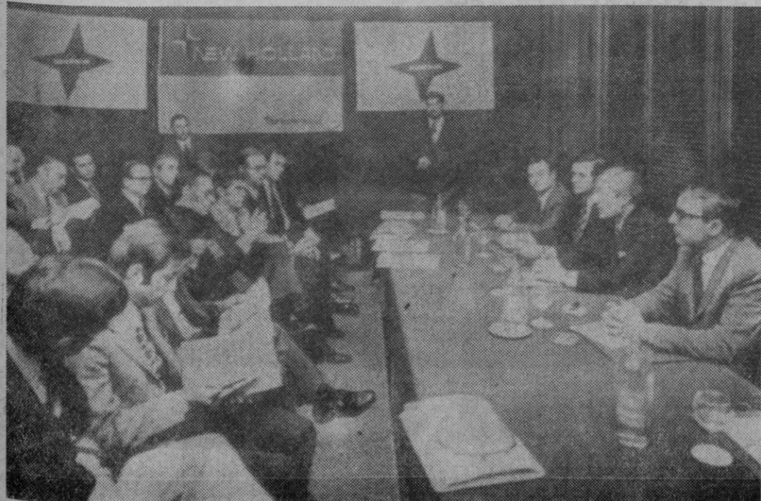
Metalúrgica de Santa Ana, S. A., ha firmado un acuerdo con la compañía New Holland, para la distribución de la línea roja. Aspecto que ofrecía la conferencia de prensa dada con tal motivo en los salones del Hotel Eurobuilding