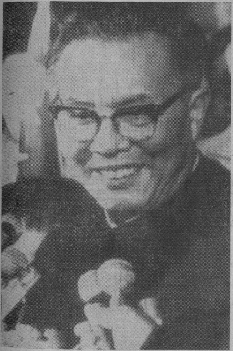
Huang Hua, hasta hoy embajador de China comunista en Canadá ha sido nombrado embajador de la China Popular ante las Naciones Unidas. Será el primer representante permanente de la China Continental en el Consejo de Seguridad.

El orden del día de esta mañana prevé la lectura del texto sobre la justicia en el mundo, que deberá ser votado mañana por la mañana.