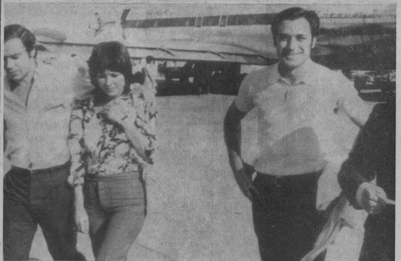
Sevilla.—El delantero centro del Valencia, Quino a su llegada al aeropuerto de Sevilla donde se reunirá con los demás componentes de la selección española.

Respecto a cómo se aplica el indulto, el señor Zavala agrega: «Lo aplican los jueces y tribunales, según corresponda, y nosotros nos limitamos a cumplir las órdenes que éstos nos dan».—Cifra.