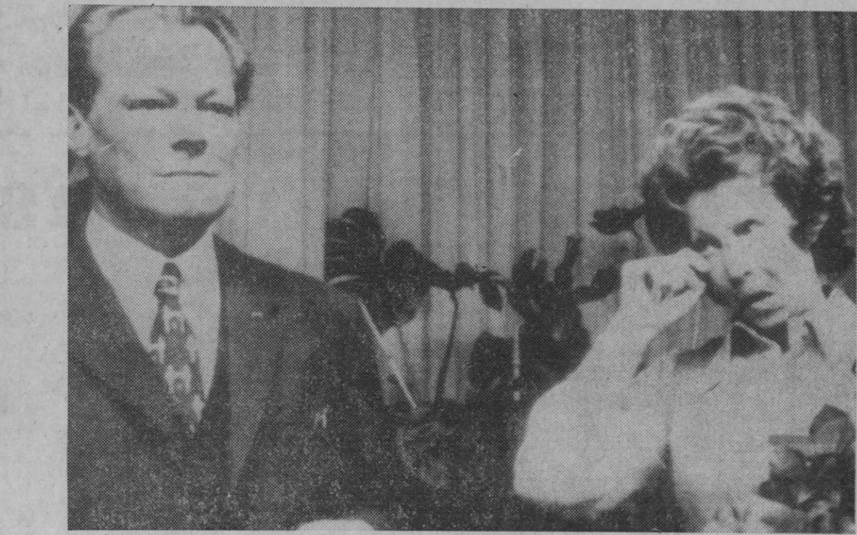
Bonn.—El canciller Willy Brandt y su esposa después de conocer oficialmente la concesión del Premio Nobel de la Paz para el canciller alemán.

La pieza, que se estrenará oficialmente el próximo domingo, 24 de octubre, Día de las Naciones Unidas, tiene letra del poeta W. H. Auden y música de Pablo Casals.—Efe.