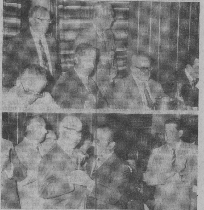
En la fotografía superior, el delegado provincial de la Organización Sindical en un momento de las palabras que pronunció; en la de abajo, el administrador de la residencia entrega uno de los trofeos concedidos a los trabajadores portugueses.

A los postres de la cena de hermandad que se sirvió, pronunció unas palabras uno de los trabajadores portu-