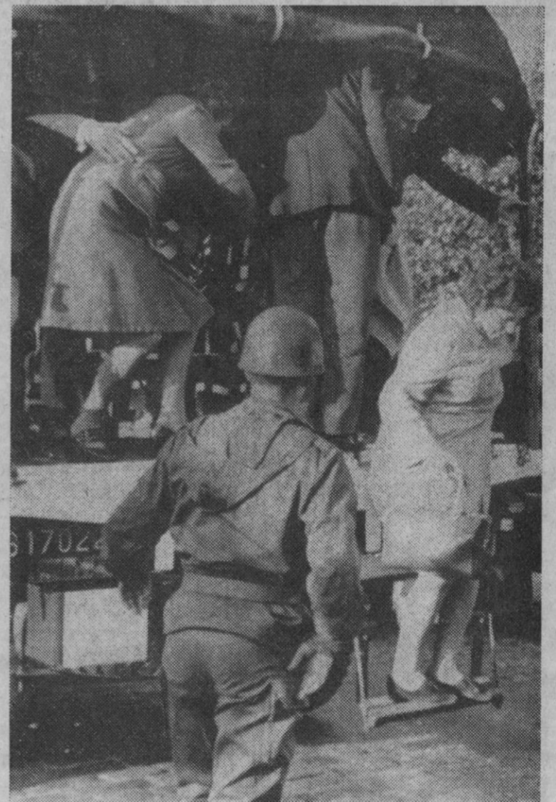
París.—Camiones del Ejército, servidos por soldados, ayudan a los parisinos a llegar a sus trabajos. París se encuentra semiparalizado en sus transportes por la huelga de empleados del ferrocarril subterráneo.—(Telefoto AP-Europa Press)

En el próximo mes de enero un grupo de empresarios del servicio técnico comercial de Industrias Auxiliares de Construcción Naval (Indunares) se trasladará a Francia en devoción de visita.—Cifra.