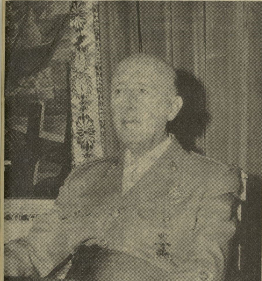
Se cumplen hoy los 35 años de aquella fecha del 1 de octubre de 1936, en la que Franco fue exaltado a la Jefatura del Estado, en Burgos, por la Junta de Defensa Nacional. Con este motivo, en la capital de España se ha tributado hoy al Caudillo un grandioso homenaje en el que se encontraron presentes miles y miles de personas llegadas a Madrid de todas las provincias españolas, congregadas, como en otras ocasiones históricas, en la plaza de Oriente, poniendo de manifiesto la inquebrantable adhesión y la más profunda gratitud al Jefe del Estado, por esta larga y fecunda paz que disfrutamos, merced a los desvelos, a la entrega total y al certero mando del Caudillo en el mejor servicio a la Patria, por el orden, la paz, el bienestar y el progreso de todos y cada uno de los españoles.

Dos millones de personas aclamaron con todo entusiasmo al Jefe del Estado al aparecer en el balcón del Palacio de Oriente