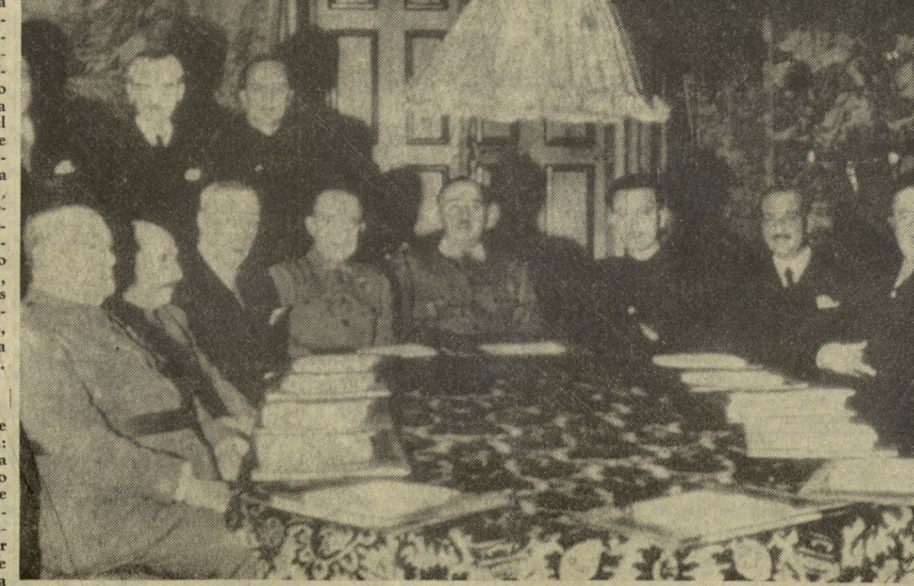
Once ministros formaban el primer Gobierno de Franco que quedó constituido en Burgos, el día 30 de enero de 1938. Eran tres militares, dos técnicos, dos monárquicos alfonsinos, dos neo-falangistas y un tradicionalista. La lista era: Vicepresidente y Asuntos Exteriores: general Gómez Jordana; Justicia: conde de Rodezno; Defensa Nacional: general Dávila; Orden Público: general Martínez Amido; Interior: Ramón Serrano Súñer; Hacienda: Andrés Amado; Industria y Comercio: Juan Antonio Suances; Agricultura: Raimundo Fernández Cuesta; Educación Nacional: Pedro Saiz Rodríguez; Obras Públicas: Alfonso Peña Boeuf; Acción Sindical: Pedro González Bueno

Afirmar la base Estas palabras de entonces, este anuncio político de Franco, decía: «Este es el caso nuestro: afirmar la base para levantar el edificio; pero que éste sea firme e inmovible y, llegado el momento, cuando nadie nos empuje y nada pueda destruir el edificio levantado ni poner en peligro lo que a tanta costa se ha alcanzado, yo traeré a vuestra deliberación las líneas finales de que vosotros elaboréis y la nación decida, sin el menor peligro para lo conquistado con tantos esfuerzos». Para que destacasen las dotes de político y de estadista de Franco, el mundo nos puso difícil la paz de España, ganada a costa de una guerra. (Continúa en la página 4)