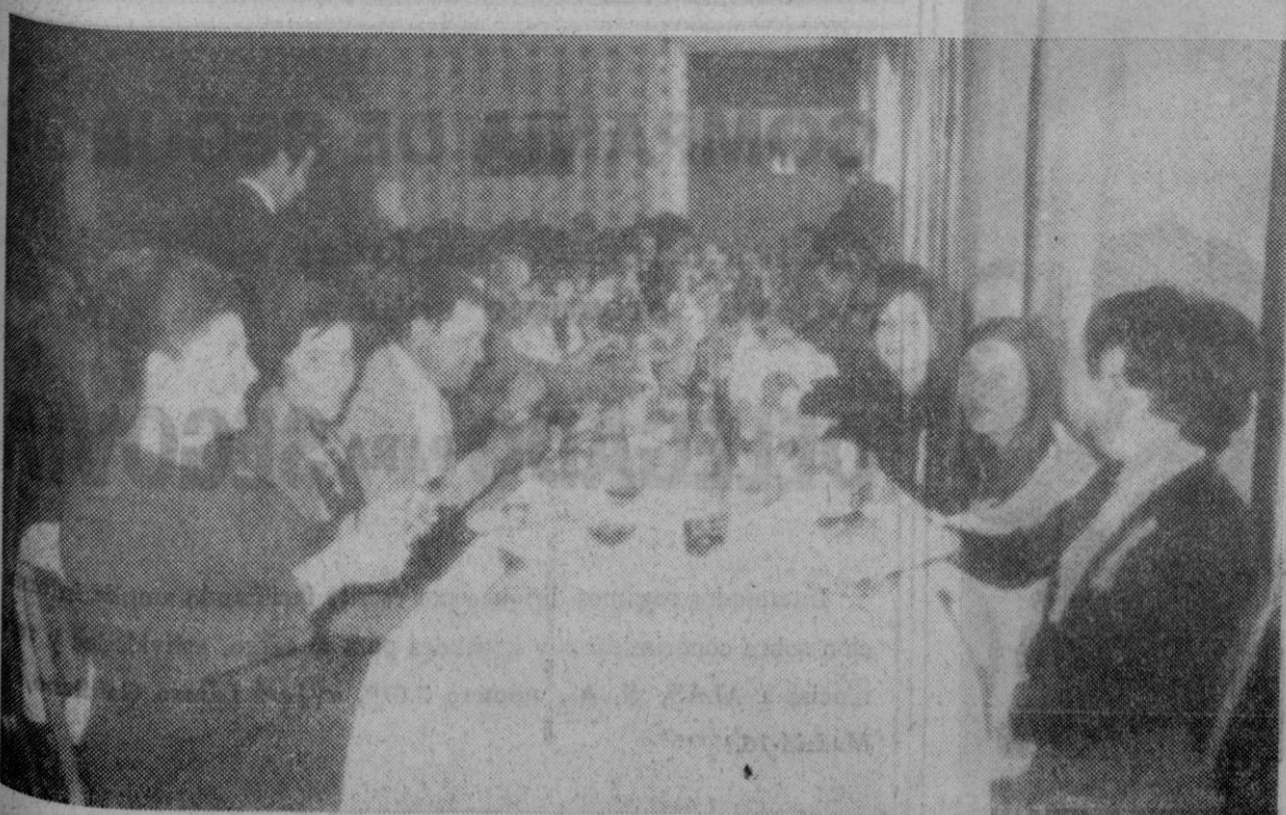
Los asistentes en la comida de trabajo

Como habíamos anunciado, nuestra ciudad fue centro de reunión de la casi totalidad de los detallistas SPAR de Segovia y su provincia. El pasado jueves, día 16, y organizado por SPAR Española, tuvieron lugar unos interesantes Cursos Monográficos de Formación Técnica, seguidos con estufo interés por todos los asistentes, quienes conocieron nuevos procedimientos para perfeccionar sus tareas de gestión comercial en cuantos aspectos se desenvuelve esta misión, tanto en el contacto con el público consumidor, como en la organización de su profesión.