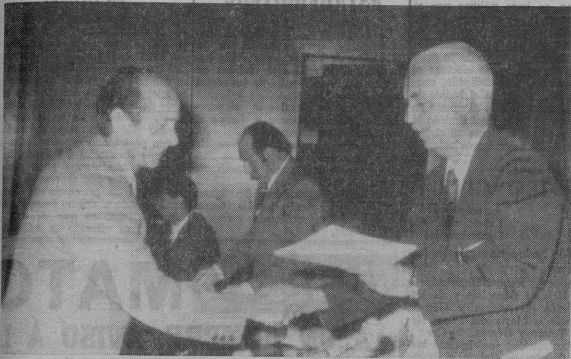
El delegado provincial de Sindicatos entregando el diploma a un cursillista