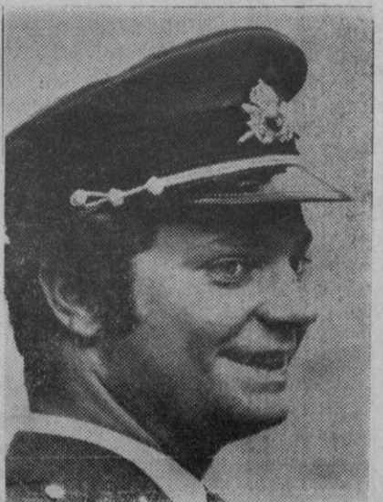
Carlos Gustavo, príncipe heredero del trono de Suecia, quien, durante un viaje de dos meses al extranjero que va a realizar su padre, el rey Gustavo Adolfo, ejercerá por vez primera la regencia