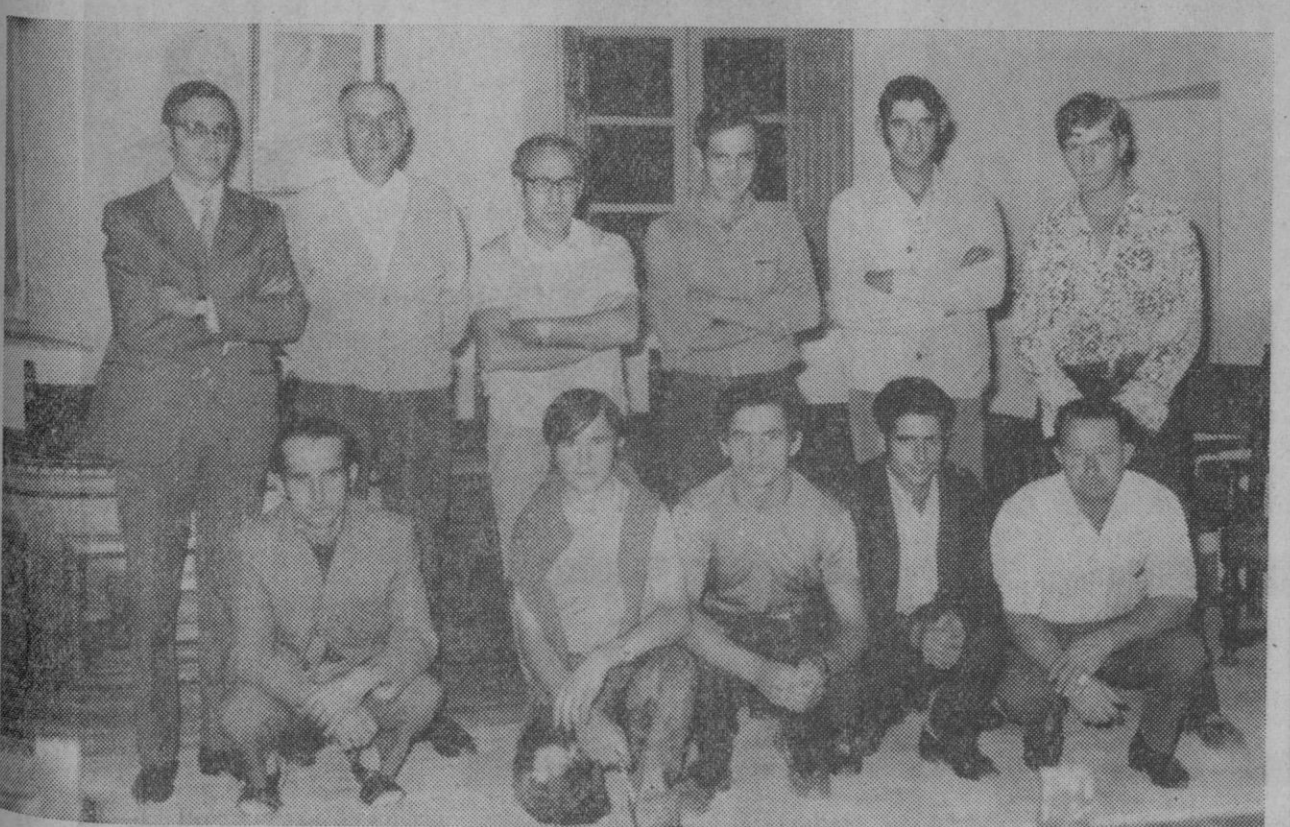
Villacastin.—El Programa de Promoción Obrera del Ministerio de Trabajo, ha celebrado en esta localidad un curso de albañilería, clausurado recientemente. En la fotografía, los alumnos posan junto al teniente de alcalde, monitor e instructor del curso.