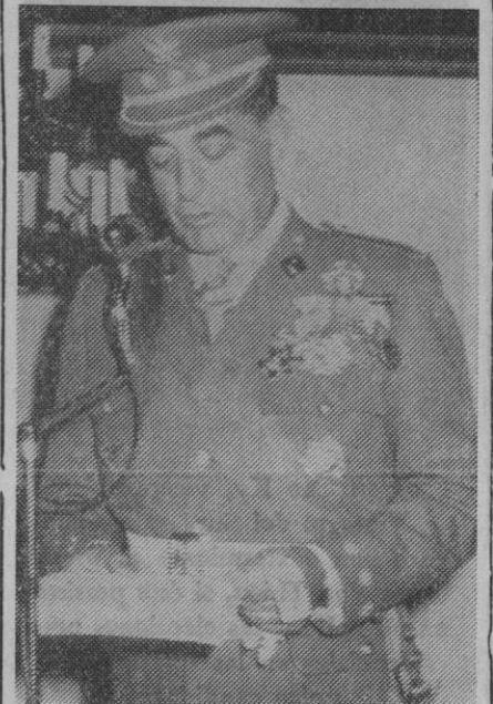
El coronel de la Academia

Tras las palabras del capitán general se entonó el himno de Artillería, y seguidamente, en la explanada de los jardines, la formación de alumnos desfiló ante él.