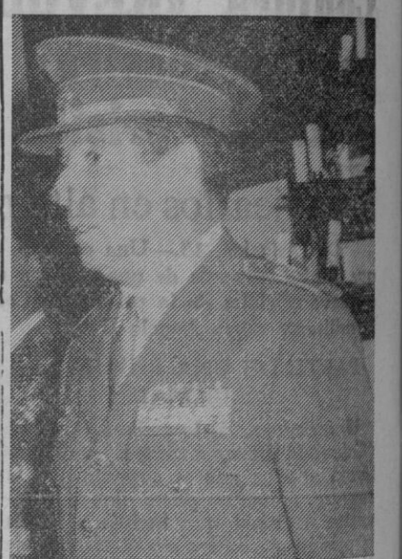
El capitán general

En el transcurso de un acto que se celebrará mañana, a las cinco y media de la tarde, en la sala de sesiones de la Delegación Provincial del I. N. P., quedará constituido el Consejo de Higiene y Seguridad en el Trabajo.