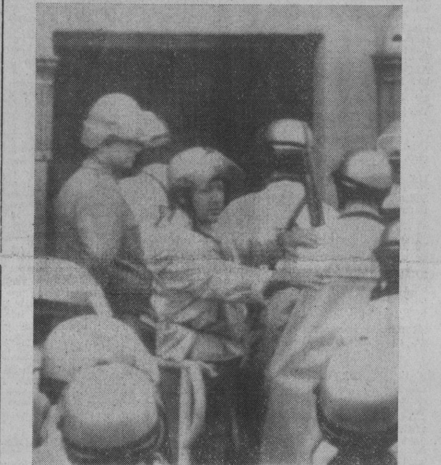
Attica (Nueva York).—Policías del condado de Erie, entran en la prisión de Attica par relevar a los policías y guardias nacionales que tomaron parte en el asalto, en una dura lucha contra los amotinados. Nueve de los 38 rehenes que estaban en poder de los reclusos han muerto, degollados por éstos.