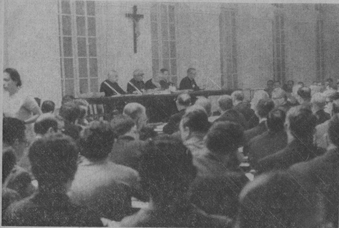
Madrid.—Bajo la presidencia del cardenal primado de España, don Vicente Enrique Tarancón, se celebra en Madrid la Asamblea conjunta de obispos y sacerdotes, con el estudio del papel de la Iglesia en la España de hoy. Antes de iniciarse las sesiones se celebró una misa solemne.

Ve en ella un sincero empeño y confirmación de la alta misión sacerdotal para servicio del pueblo de Dios