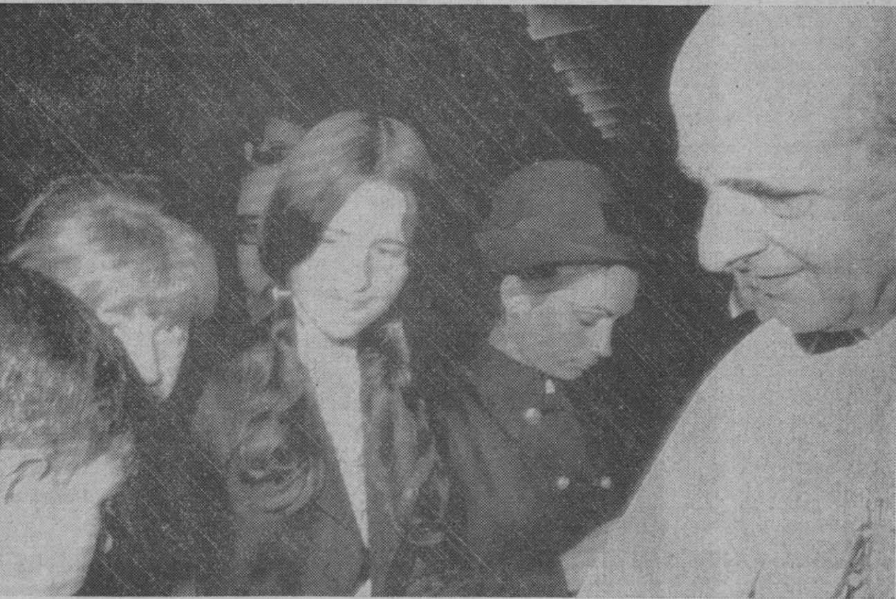
Castelgandolfo.—El Papa Pablo VI con los niños de la Operación Plus Ultra, durante la audiencia del Pontífice a este grupo en su residencia de verano en Castelgandolfo.

Temperaturas extremas de España: Máxima de 31 grados en Almería, Victoria, Zaragoza, Jaén y Córdoba. Mínima de diez grados en Lugo y León.—Cifra.