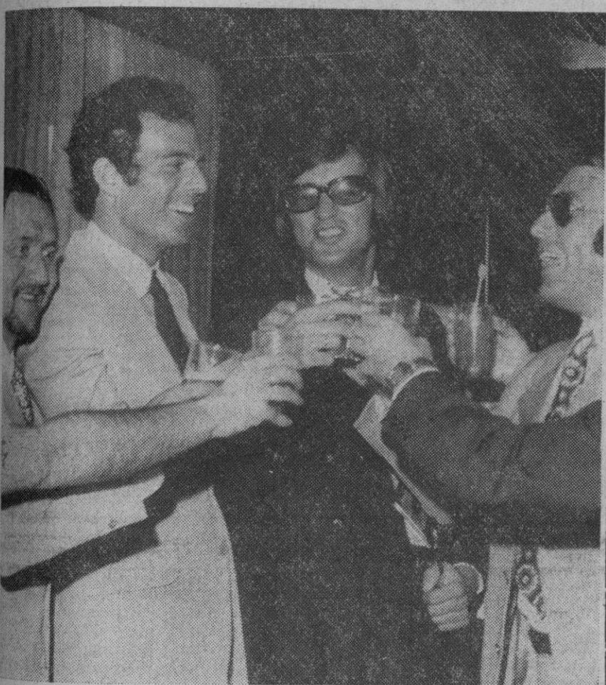
Madrid.—El cantante Julio Iglesias celebra el nacimiento de su primera hija, con una pequeña fiesta dada la pasada noche en Madrid.

La animosa señora llegó este mediodía al aeropuerto de Madrid-Barajas procedente de Casablanca.—Cifra.