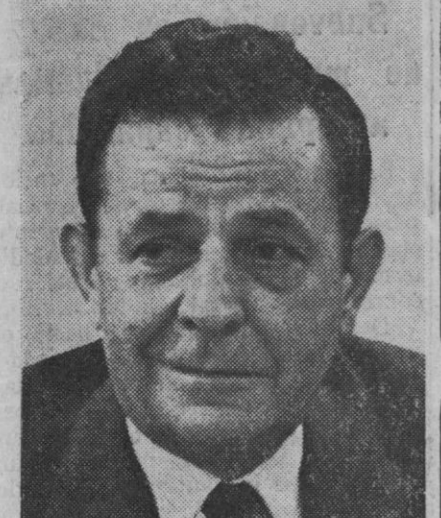
Pierre-Paul Schmitter, director del Fondo Monetario Internacional, quien preconiza una devaluación directa del dólar por aumento del precio del oro

Santander, 30.—En la Casa Sindical de Santander se han reunido hoy los presidentes de las Cámaras Oficiales Sindicales Agrarias del Norte de España.