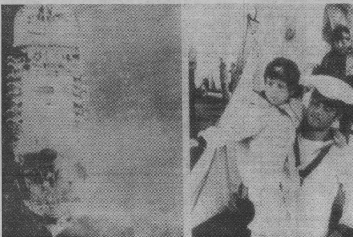
Bari (Italia).—El ferry griego «Hellenia», izquierda, se incendió en el Adriático con mil personas a bordo. Varios buques participaron en el rescate, entre ellos unidades de la Armada italiana. Un marinero, derecha, desciende en Bari con un niño superviviente en los brazos.