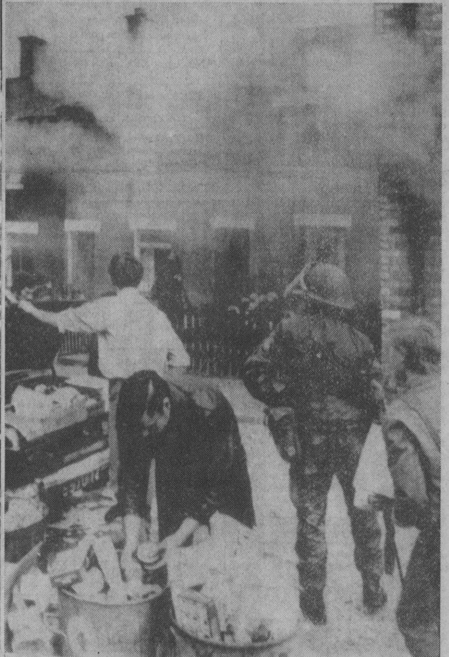
Belfast.—Arde una casa perteneciente a protestantes en Crabrook Crescent, en el área Ardoyne, de Belfast. Las llamas de la casa se veían muy bien desde el aeropuerto. Un hombre trata de recuperar algunos objetos. Los bomberos intentaron detener a los incendiarios, pero se dieron a la fuga.

Arbatov pone de relieve que si la visita del presidente Nixon trajera un inocente relajamiento de las tensiones «ello sería positivamente apreciado en la Unión Soviética pero existen bastantes indicios para esperar que los acontecimientos se desarrollen de manera diferente».—Efe-Upi.