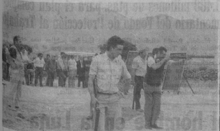
Un momento de la tirada celebrada en el complejo Los Angeles de San Rafael

La Federación Segoviana de Tiro ha organizado las tiradas al platanístico de Los Angeles de San Rafael, empresa que está decidida a efectuar un lanzamiento de variadas actividades deportivas, a las que va a prestar el máximo apoyo.