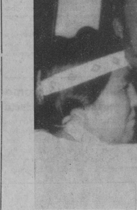
Castelgandolfo.—El Papa Pablo VI sonríe cuando una india de la tribu de Blackfoot le coloca un collar indio. La mujer era parte de los 41 indios recibidos por el Papa en audiencia especial.

En una para vinificación, las perspectivas son muy variadas. Van desde las cosechas desastrosas a las buenas, como la que tienen en la Mancha, auténtica «bodega de España».