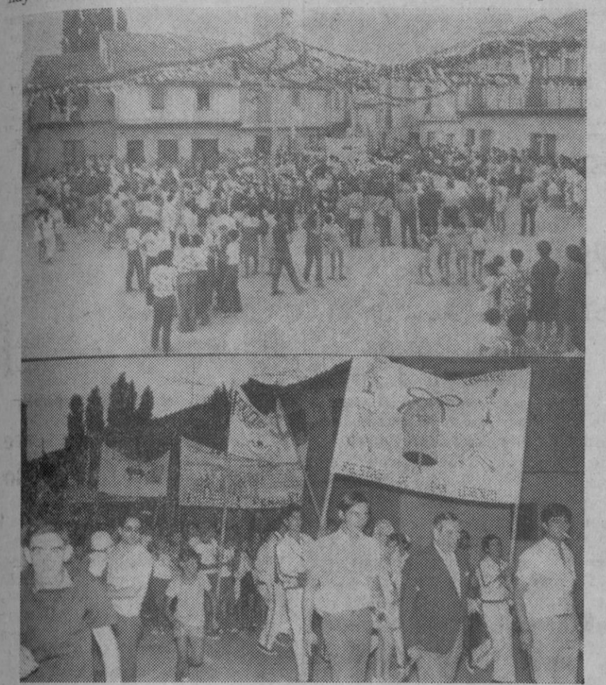
Las «peñas», antes de desfilar, se congregaron en la plaza de san Lorenzo, entre la curiosidad del público. Abajo, el alcalde del barrio y los de las fiestas, presidieron el paso de los grupos de jóvenes por las calles.

El disparo de cohetes y el sonido de la dulzaina y el tamboril anunciaron ayer, profusamente, el comienzo de las fiestas en el barrio de San Lorenzo. A partir del primer "chupinazo", la alegría se desbordó, y todos nos alegraremos que dure, sin tasa y en grata armonía, durante las próximas jornadas. Al final, que San Lorenzo dé a cada cuerpo el descanso reparador de tanto jolgorio como se prevé. Catorce peñas, catorce señores, hay este año en la populosa barriada.