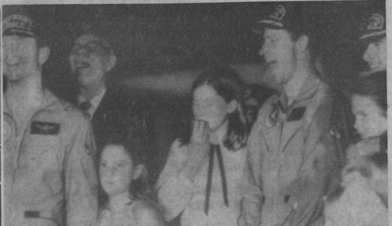
Base de Ellington.—Los astronautas del «Apolo 15» sonríen de un chiste que sus hijos no entienden. La foto está tomada en la base militar de Ellington.