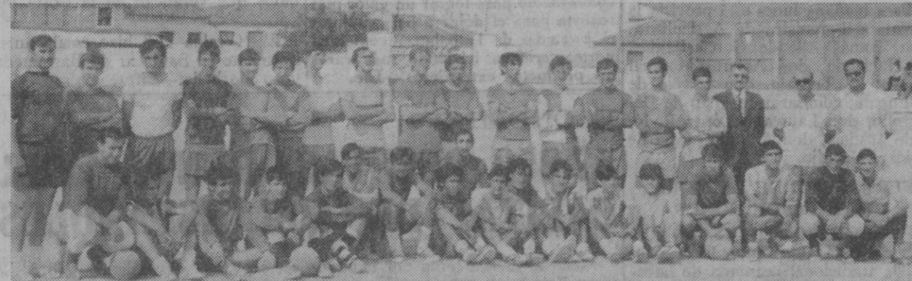
Ayer celebraron su primer entrenamiento los jugadores que hasta el presente han fichado por el C. D. Acueducto. En El Peñasal realizaron diversos ejercicios gimnásticos, faltando a la sesión algunos jugadores que contaban con permiso del club. Al final de esta primera sesión, los jugadores del equipo titular y los del juvenil, que compartieron el entrenamiento con aquellos, posaron juntos para el fotógrafo. Y con ellos, «Pilín». ¿Quiere decir algo la presencia del entrenador segoviano en la sesión de ayer, aunque solamente asistiera como espectador?

El otro corredor español del equipo A, Aurelio García, se clasificó en decimosexto lugar, con un tiempo de 2-40-25.