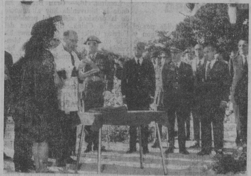
Un momento del acto de bendición del edificio.