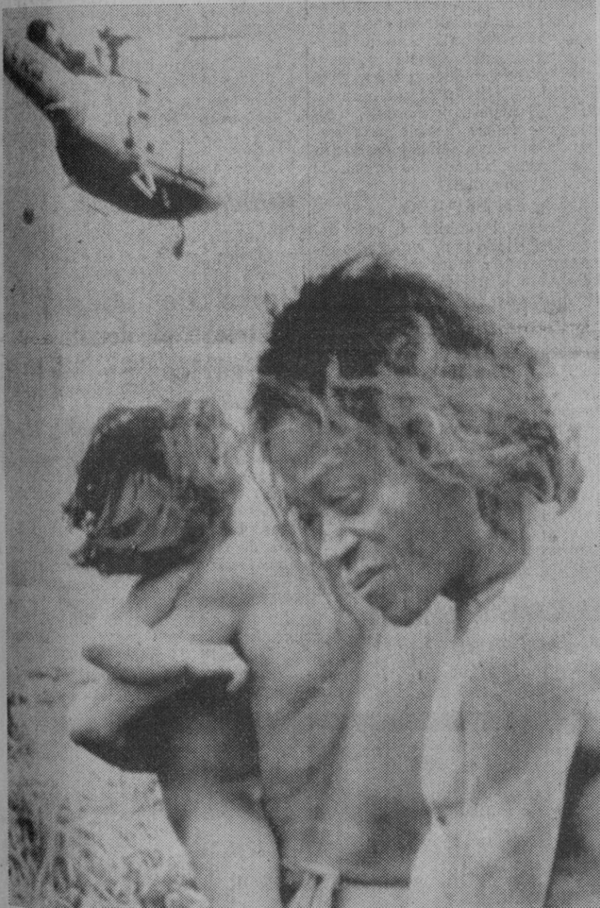
Nueva York.—Miembros de la tribu Tasaday, recientemente descubierta, esperan el descenso del helicóptero que trae a algunas personalidades interesadas en el estudio de dicha tribu filipina, hasta ahora viviendo en la edad de piedra. Los Tasadays consintieron en encontrarse con lo que ellos llaman el «pájaro gigante», el helicóptero, después de haberles prometido que en él se transportaban comidas y regalos para ellos.

—Las propuestas deberán ser dirigidas a la Dirección General de Industrias Siderometalúrgicas y Navales antes de las doce horas del día 30 de octubre de 1971.—Cifra.