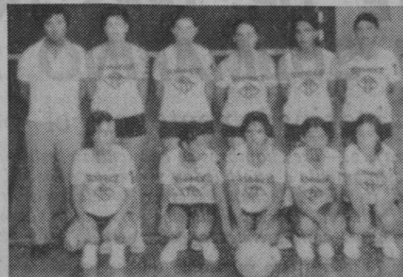
En la fotografía superior, el equipo de la Obra Atlético Recreativa (O. A. R.) de Castellón. En la inferior, las chicas del Imperio.