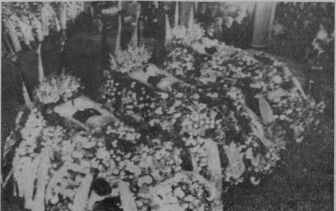
Moscú.—Vista general de la sala de la «Casa del Ejército», en Moscú, donde se habían instalado túmulos de los tres astronautas del «Soyuz 11». Miles de moscovitas han desfilado para tributarles el último adiós.

CONDUCTOR: Recuerde que debe facilitar la maniobra de un vehículo que le adelante y para ello debe ceñirse a su derecha