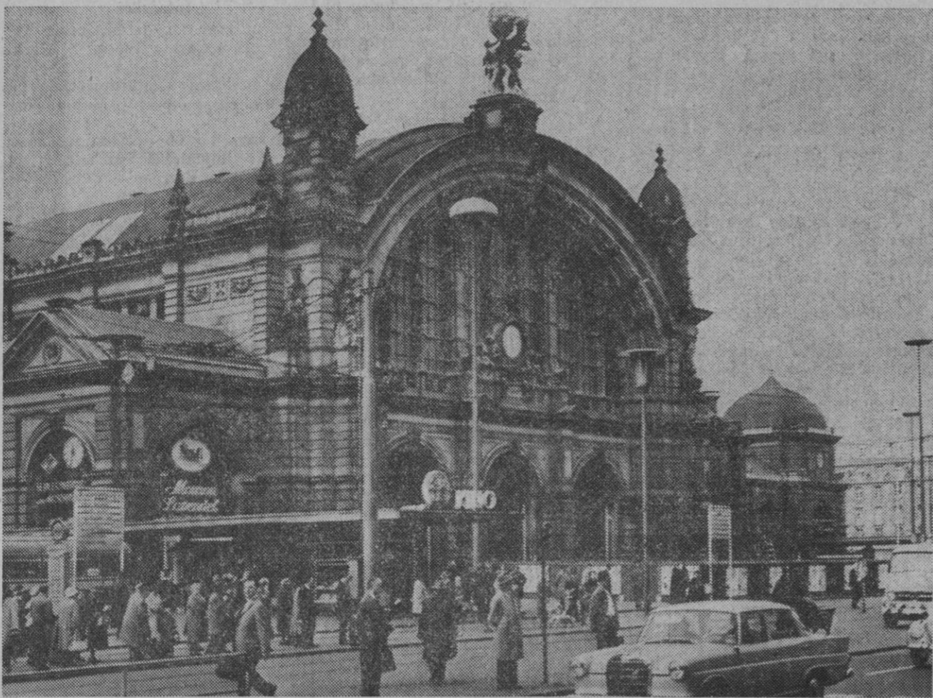
Frankfort del Meno.—Una parte de la estación central, para la cual se quiere derribar el ala septentrional y reedificarla más tarde según los planos primitivos. Expertos de los Ferrocarriles Federales han calculado que este procedimiento poco común resultará más barato que las extensas medidas de apoyo que hubiera exigido la construcción del ferrocarril metropolitano con el edificio dejado en pie.—(Foto DaD)

Submarinistas y equipos de rescate se habían terminado durante toda la noche a fin de elevar al submarino lo suficiente como para que pudieran salir sin grandes riesgos.—Efe-Reuters.