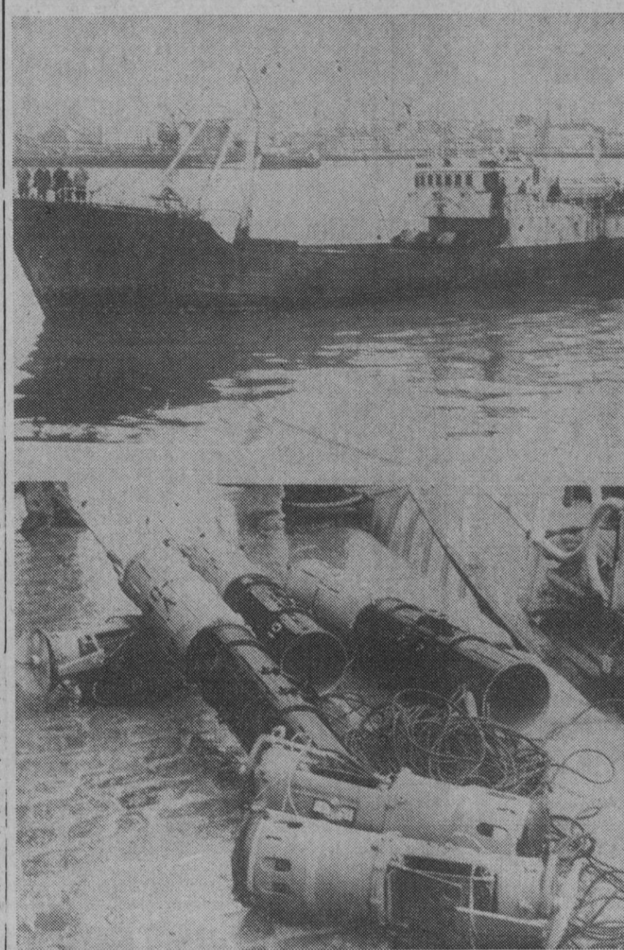
La Coruña.—Arriba: El pesquero «María Victoria Moyano», llegando a puerto. Abajo, las tres boyas recogidas en la zona del «Gran Sol», ante las pasadas sobre el barco de un avión que lanzó varias bengalas, y de los disparos de ametralladora lanzados por un submarino, no identificado que apareció después. El «misterio» de las boyas, del avión y del submarino aún continúa...—(Foto Europa Press)

La nave y el cohete Atlas Centauro que impulsó al «Mariner 9» pesan una tonelada y la duración del viaje hasta Marte se calcula en seis meses.—Efe.