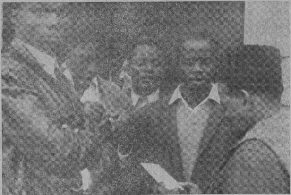
Bilbao.—Esos son parte de un grupo de senegaleses y congoleños que han sido expulsados de Francia por no tener contratos de trabajo y que han penetrado en España.

Palencia es la primera provincia española donde se ha implantado el registro oficial del libro genealógico de la raza ovina churra. El control afecta a más de setenta rebaños, con unas cuatrocientas veinte mil ovejas. En el programa "En este país" de TVE, vimos la entrega de subvenciones que el Estado concede a los núcleos registrados selectos de la raza ovina churra y que asciende a más de ochocientos mil pesetas. También se entregaron los premios de rendimientos lecheros de las mencionadas churras. Resultó campeón la oveja "Añoza", con una producción controlada de 700 litros en doscientos días.