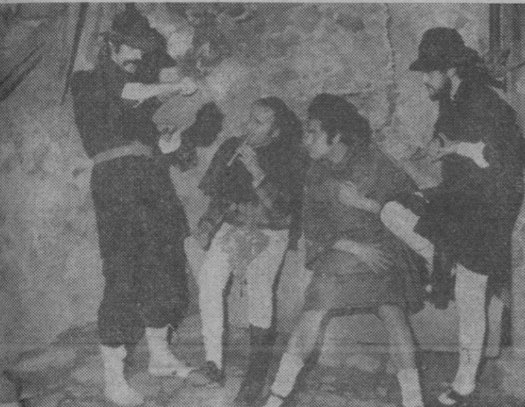
Una de las escenas que se están «rodando» en Segovia.