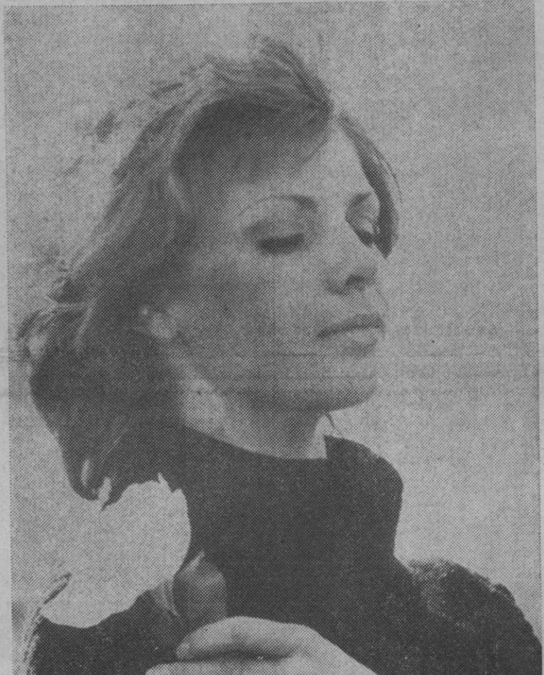
Esta es Severine, vencedora del Festival de la Canción de Eurovisión. Su verdadero nombre es Josiane Grizeau, nacida el 10 de octubre de 1949 en París. Tiene 1,55 de estatura y pesa 49 kilos. Sus cabellos son dorados y tiene los ojos castaños.

protagonistas miles de chicanos. «Hemos tenido muertes y un millón de dólares en pérdidas», agregó Montes al subrayar que en los desórdenes urbanos que se avecinan no sólo se rebelarán los negros sino los mejicano-americanos y miembros de otras minorías oprimidas por la injusticia y la pobreza. Efe.