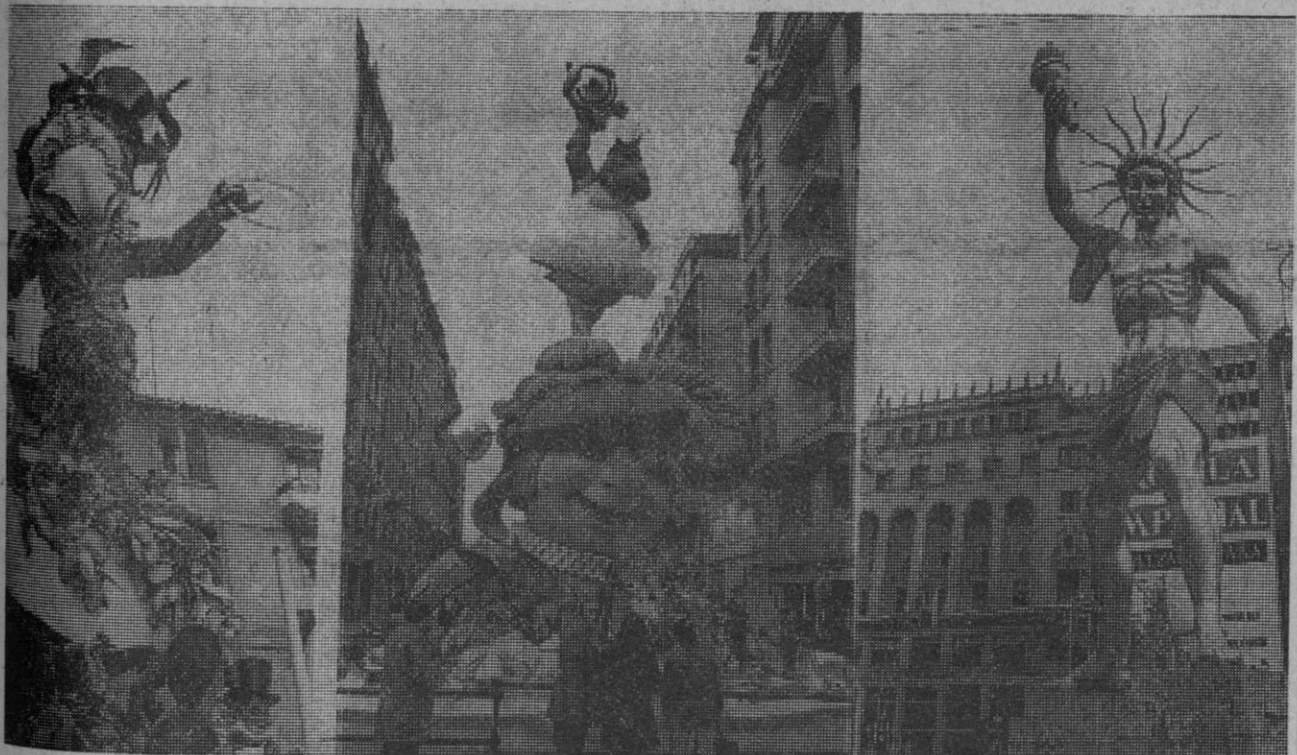
Valencia.—Las fallas ya están en pie y morirán así, como los árboles, en la noche de San José. Valencia ha visto crecer en sus calles y plazas las fallas mil novecientos setenta y uno. Ahora, días antes de la cremá, lucen así de esplendorosas.

Washington, 17.—Estados Unidos intentará el envío de un vehículo espacial no tripulado para recoger muestras del asteroide Eros en 1977, han informado en Washington circulares allegados a la N. A. S. A.—Efe.