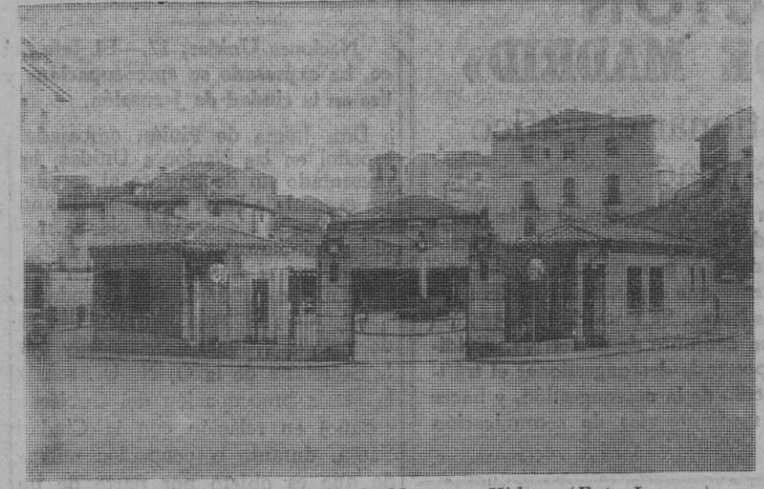
Entrada principal al mercado de Muerte y Vida.

cuadrados, limitado por las calles Puente Muerte y Vida y Buitrago; como es sabido, constituye hoy un gran peligro para el tráfico. De los mil quinientos metros cuadrados corresponden a soportales y puestos cubiertos, mientras que el resto se destina a patio central. Son treinta y dos los puestos que existen en este mercado pero solamente nueve suelen abrirse.