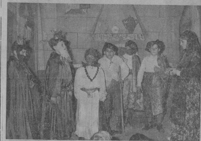
Una escena de la fiesta celebrada en la catequesis de las RR. Reparadoras, presentada con excelente gusto.

En el salón de actos de la residencia de las religiosas Reparadoras ha tenido lugar una simpática fiesta en la que intervinieron los niños y niñas que asisten en dicho centro a la catequesis. Se representaron escenas diversas y, por supuesto, varias relacionadas con la Navidad, siendo digno de destacar la sobresaliente ac-