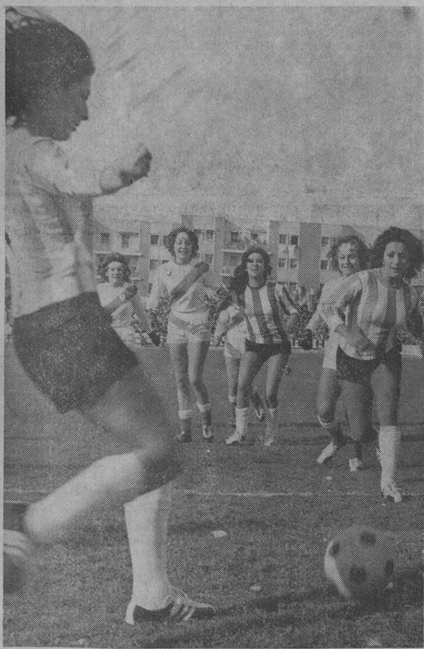
Madrid.—Un momento del divertido encuentro que en la mañana del domingo disputaron en el estadio de Vallecas "folklóricas" y "fínolis", y que terminó con empate a un gol. El partido fue entretenido y sirvió para descubrir nuevos valores, sobre todo en algunas "delanteras".

Niño de Segovia; los Reyes Magos llegarán el día 5; sal a las calles a saludarles