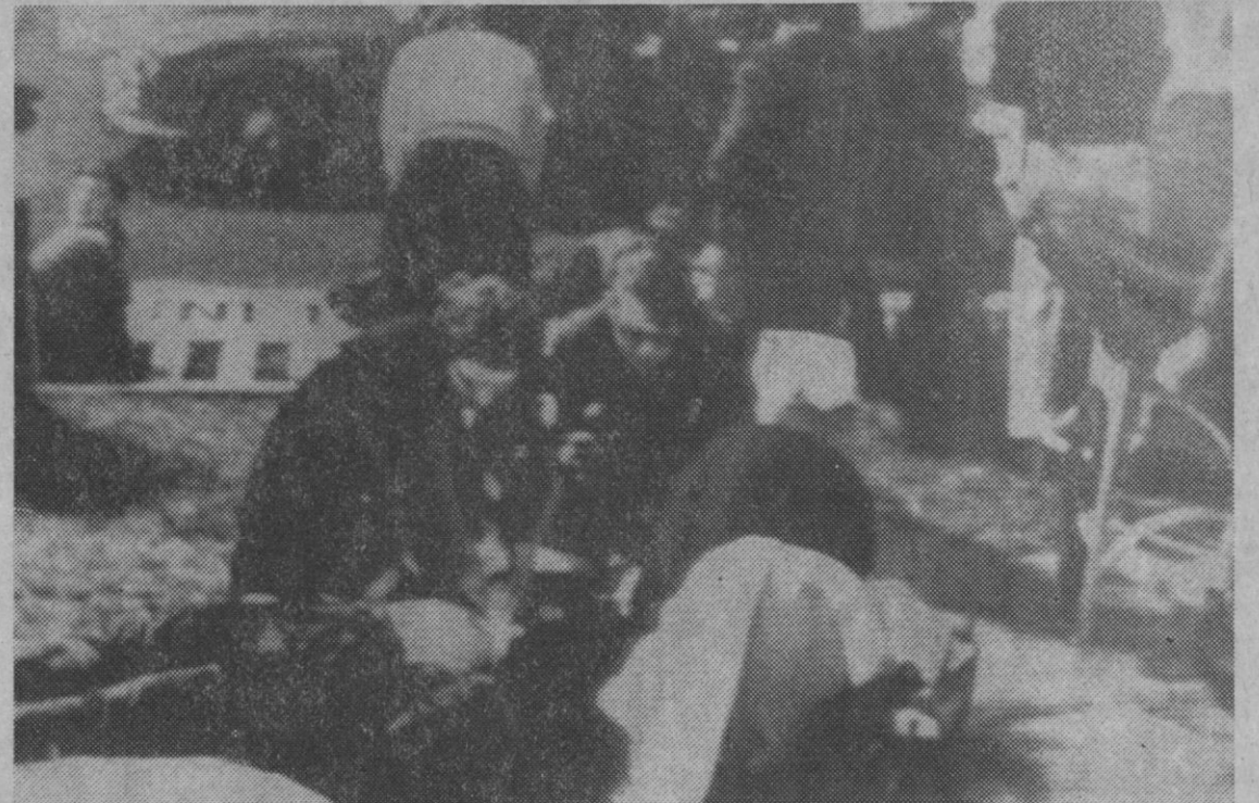
Glasgow (Escocia).—Un herido es asistido junto a los graderos del estadio de Ibrox-Park, poco después de que una valla protectora se derrumbara sobre la multitud durante el encuentro entre Glasgow Rangers y Celtic. Sesenta y seis personas resultaron muertas y más de cien heridas en la catástrofe.