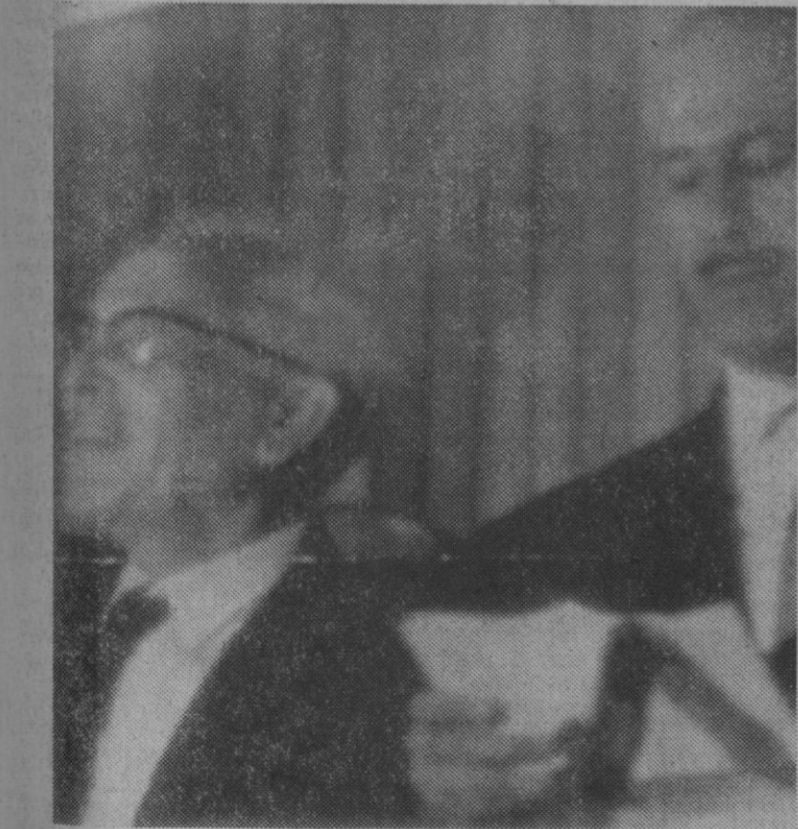
Beirut.—Suleiman Franjien, nuevo presidente electo, saluda a la multitud y a los miembros del Parlamento, después de su victoria por un voto. A su derecha aparece el portavoz de la Cámara, Michel Sessin.

Dusseldorf, 18.—Los medios informativos alemanes hacen resaltar hoy que el capitán del equipo español de tenis, Jaime Bartrolí, se disgustó con Manuel Santana, quien abandonó Dusseldorf antes de lo previsto sin avisar a sus compañeros y se trasladó a Ginebra en avión. Según las fuentes alemanas, Santana «remontó el vuelo al tener noticia de la victoria de Kuhnke sobre Orantes». Añaden las informaciones deportivas alemanas que la lesión que alegó Santana fue sólo un pretexto para obtener la conformidad del juez árbitro.