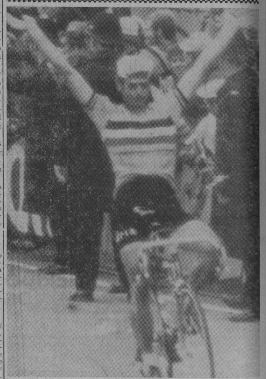
Mallory Park.—Jean Pierre Monsere, de Bélgica, cruza en solitario la línea de meta, proclamándose campeón mundial de ciclismo en carretera para profesionales.—(Telefoto Ap-Europa Press)

El Jefe del Estado, que había llegado al coto de Chelo momentos después de las cinco de la tarde, pasados las nueve de la noche regresó al pazo de Meirás.