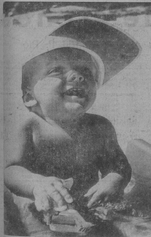
Cuidándolo bien, también el bebé podrá disfrutar del verano.

Estamos en pleno verano, y todos sufrimos a causa del calor. Sin embargo, los que peor lo pasan son los bebés. No tienen aún las defensas naturales de las personas mayores, y sufren mucho cuando la temperatura sube.