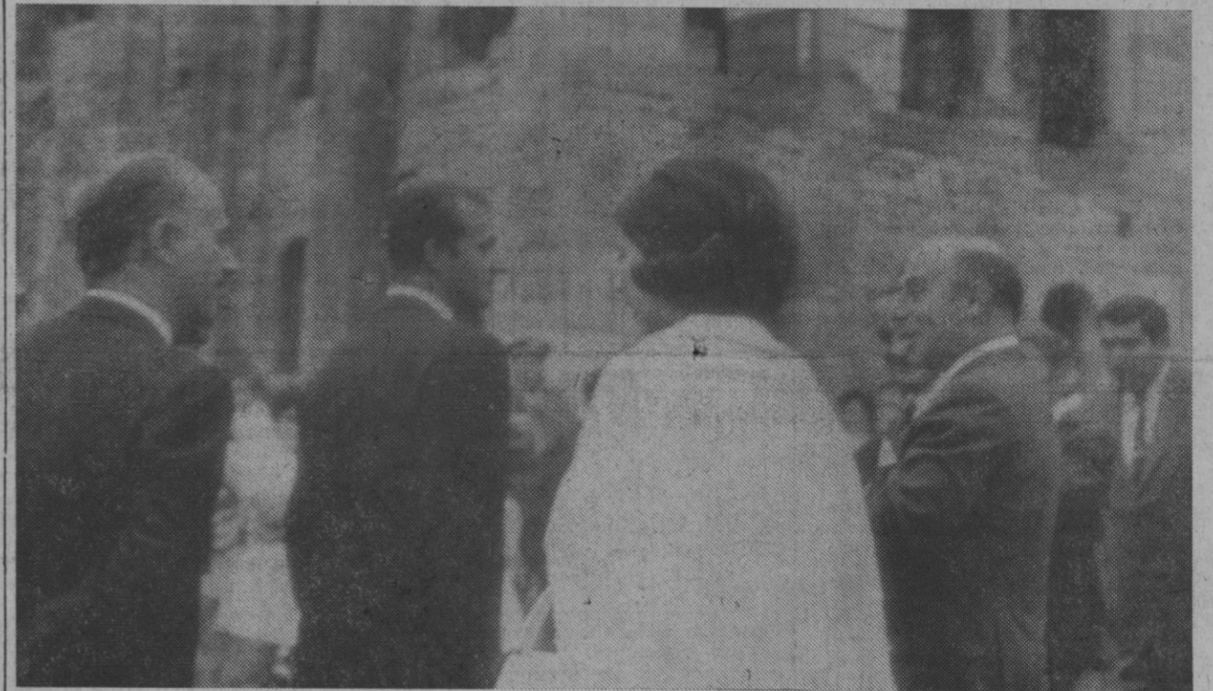
Oviedo.—Los Príncipes de España, don Juan Carlos de Borbón y doña Sofía, durante su visita a distintas zonas de la región asturiana.

El Santuario de la Fuencisla, centro espiritual de Segovia, es cosa de todos. No olvide aportar su donativo para las obras de consolidación.