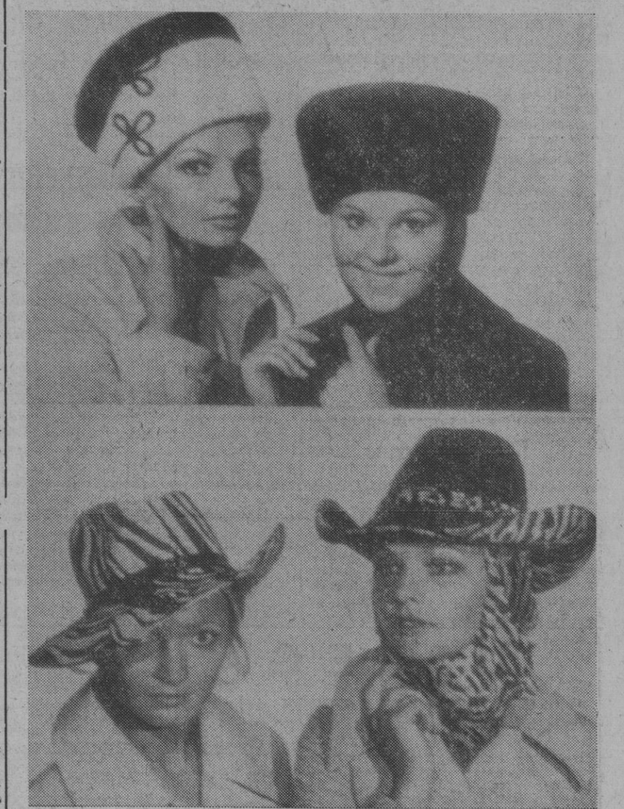
Düsseldorf (DaD).—Elegante más no extravagante se presenta, procedente del Seine, la moda de sombreros para señoras, para el invierno 1970-71. Modelos según prototipos parisienses fueron demostrados al comercio del ramo de la República Federal de Alemania en Colonia y Düsseldorf en la Exposición Federal de la modistería alemana. Tres líneas principales determinan la tendencia: Caatashok, Charleston y «España-Lock». Nuestra foto muestra arriba lo que se entiende bajo caatsats—nombre de un baile de moda—: una especie de toca cherquesa. El elegante modelo de sport «España-Lock», abajo, proporciona a la portadora la posibilidad de doblar el ancho ala, según sus ganas, lateralmente o delante.