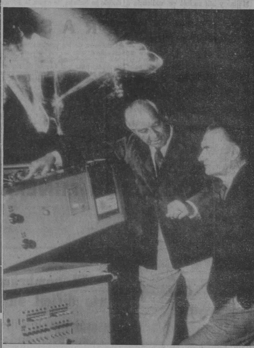
Munich (DaD).—Impresiones de colores, como en un sueño, y formaciones luminosas de una variedad casi ilimitada se pueden producir ahora como por encanto sobre todo escenario. Fue empleado por primera vez este laser escénico, desarrollado en la República Federal de Alemania, en el Teatro Nacional de Munich, en la ópera «La flauta mágica», de Mozart.

Las imágenes laser, tridimensionales, que se dejan repetir, en cuanto a su forma, combinación de colores y desarrollo de movimiento, exactamente cuantas veces se quiera, se producen con relativa sencillez: haces de rayos laser, en abanico, chocan contra «cuerpos de dispersión», de vidrio estructurado, móviles mecánicamente; los diferentes rayos son refractados varias veces, reflejados y orientados en varias direcciones al espacio. Como fuente sirven laser que irradian luz roja, verde y azul.