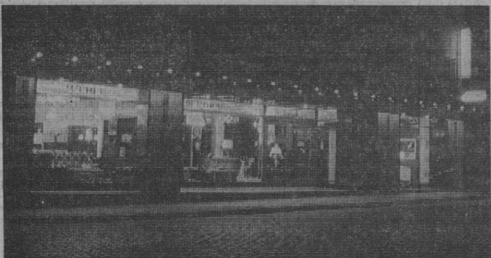
Esta es nuestra sucursal

En la ciudad, hoy, la normalidad es, pues, completa y por primera vez después de los incidentes del día 21, se trabaja en la forma habitual y a pleno rendimiento en todos los sectores laborales.—Cifra.