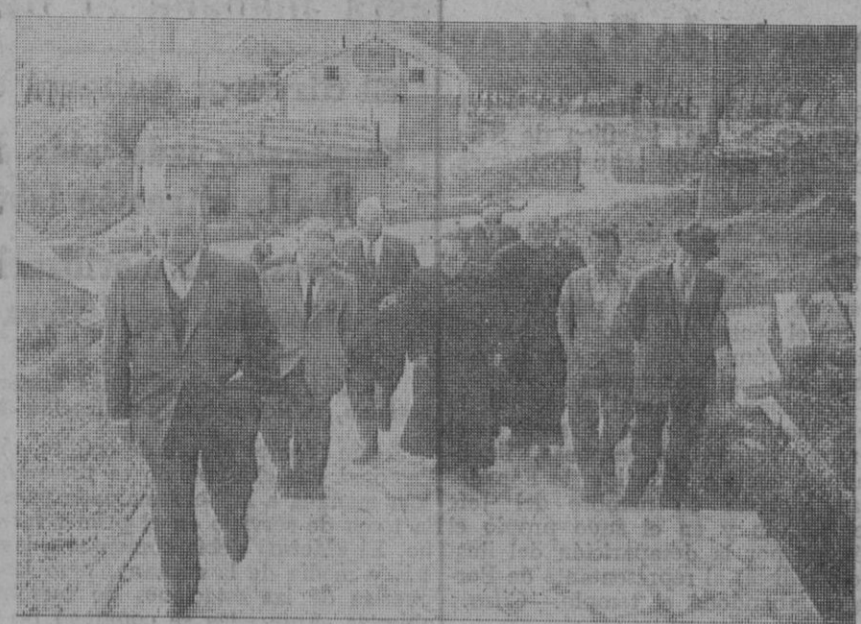
El obispo de la diócesis durante su visita a las obras de construcción de las viviendas.

Concretamente no hace mucho tiempo hacíamos alusión al grupo de 24 nuevos hogares que se han levantado en unos terrenos próximos al Puente de Hierro, y que se piensan