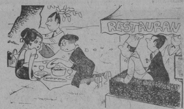
—Creo que mi nuevo guisado tiene éxito.