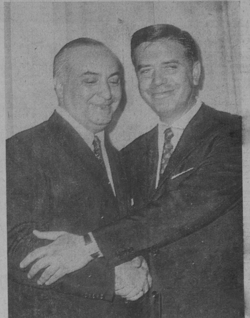
Madrid.—El ministro de Hacienda, señor Monreal Luque, felicita al nuevo gobernador del Banco de España, don Luis Coronel de Palma, después de la toma de posesión de su cargo.

SEGUNDO.—Si la irregular situación persistiera durante todo el día de hoy, propondré al ministro de la Gobernación, para que éste a su vez lo haga al Gobierno, la movilización inmediata del personal de esa empresa de acuerdo con las disposiciones vigentes, todo ello sin perjuicio de las responsabilidades laborales y penales en que se haya incurrido o pueda incurrirse y que se exigirán con el máximo rigor.—Cifra.