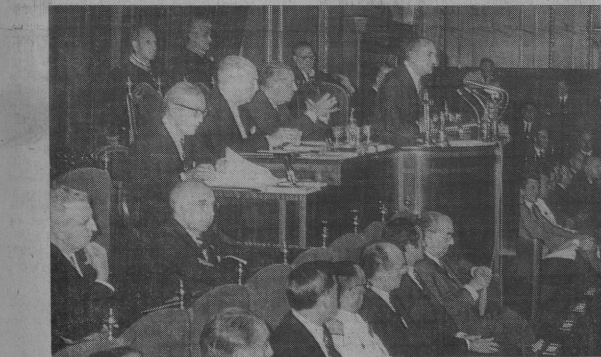
Madrid.—El presidente de las Cortes, señor Rodríguez de Valcárcel, pronuncia unas palabras en memoria del fallecido capitán general don Agustín Muñoz Grandes, durante la sesión del pleno celebrada ayer. En primer término los miembros del Gobierno.