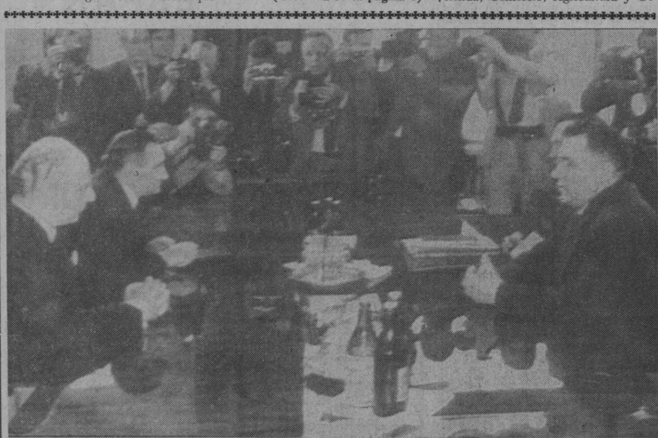
Moscú.—Walter Scheel y Andrei Gromiko, presiden las delegaciones de sus países en las conversaciones para un pacto de no agresión Bonn-Moscú.

«Esta actuación, calificada en un vertiente tan significativa de nuestro sistema crediticio, nos permite acoger la fecha de hoy con la mayor esperanza. En estos momentos en que intentamos trazar rumbos nuevos para nuestras instituciones monetarias y crediticias y proyectamos una renovada estructura para nuestro sistema financiero, yo espero mucho de su colaboración, del entusiasmo y de la iniciativa de este puesto de avanzada de nuestra política monetaria, que es el Banco de España, a quien convoco, en la persona de su ilustre nuevo gobernador, a continuar animosamente en la ambiciosa tarea que se abre hoy con los mejores auspicios de un día inaugural.»