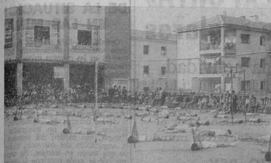
En el grupo escolar "Villalpando" se ha celebrado un animadísimo festival gimnástico-deportivo, con motivo del fin de curso en el que participaron numerosos alumnos. Acudió gran cantidad de público.