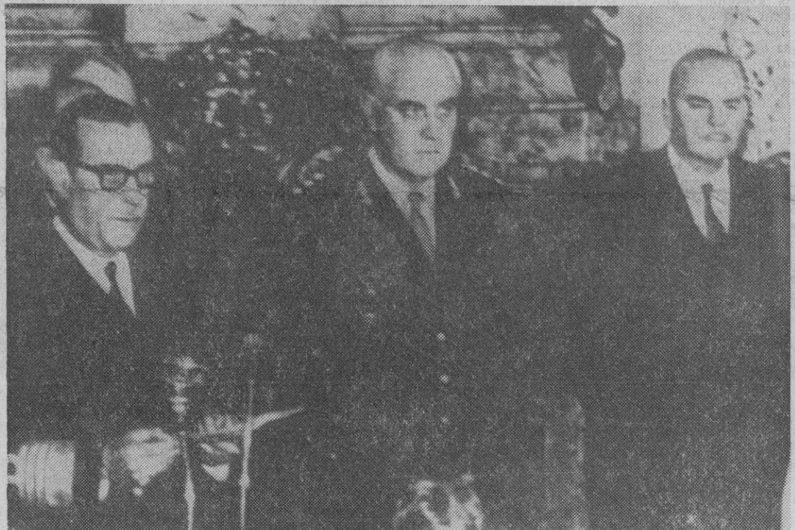
Buenos Aires.—Los miembros de la nueva junta militar del Gobierno argentino aparecen en Buenos Aires durante la ceremonia de su juramento oficial. Los tres hombres de la junta derrocaron al presidente Onganía y elegirán un nuevo presidente en el curso de diez días. De izquierda a derecha: almirante Pedro Gnavi, general Alejandro Lanusse y brigadier Juan Carlos Rey.